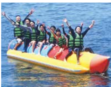
最初にバナナボートにのった。スピードが速くてジャンプしてすごい楽しかった!