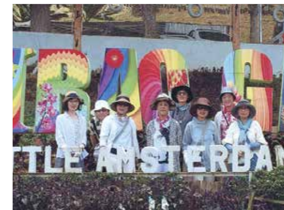
船に乗りシュノーケリングのできる島へ!船上でのバーベキューも格別でした!

いつかは行ってみたいと思っていたセブ島。姉と一緒に8名のグループに参加させていただきました。初めてお会いする方々ともすぐ打ち解けて、4泊5日の旅がより一層楽しく思い出深いものになりました。朝、素敵なお部屋から真っ青でキラキラした海と、ブーゲンビリアの花が目飛び込んで来ました。メイドさんが作ってくれたフレッシュなジュースと生マンゴー付きの朝食。もうこれだけで幸せな気分です。船に乗りシュノーケリングのできる島へ。海へ入るのも久しぶり。海の中を泳ぐキレイな魚たちを見て最高でした。船上でのバーベキューも格別でした。露店でのショッピングはデパートとは違い、格安でちょっと変わったものばかり!お店の人との片言の英語や身振り手振りでのやり取りも楽しいひと時でした。アメージングショーは、美男美女?!による最高のエンターテイメント!!グループの一人が舞台上に連れられて一緒に踊るハプニングもあり、大いに盛り上がりました。フラワーパークという新しい施設にも行き、日本では見れないような珍しい花も見て来ました。マッサージには2回も通い、その気持ちよさにずいぶん癒されました。最後の夜に開いてくれたパーティー。フィリピン料理を囲み、生演奏でみんなで歌い踊ったことは一生の思い出です。朝早くから夜遅くまで案内してくれた通訳さん、ドライバーさん、メイドさん。ご一緒したグループのみなさん、本当にありがとうございました。またいつか来てみたいです。