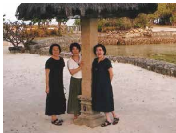
ゆっくりのんびり、毎日マッサージ。想いが叶った7日間でした!

初めての海外、それも今人気のセブ島!会員になってわずか数ヶ月、何十年来の友人に誘われて参加、ワールドビッグフォーを覚えてくれたのも彼女。現地時間19:30頃到着。機内から見たセブ空港の広さ明るさにビックリ!車の多さ、人の多さ(特に子供)に2度ビックリ。現地料理を堪能してコーラルポイントリゾートへ。遅い時間にもかかわらず、若いメイドさんが全員笑顔で歓迎。部屋の広さ、豪華さにまたまたビックリ。翌日、フットマッサージ、ショッピング、中華料理。夕方戻ると担当のメイドさんは、私の顔をしっかりと覚えてくれて、サッと荷物を持ち部屋へ。優雅な気持ちにさせて頂きました。次の日、無人島でバーベキュー、夕方、翌日帰る方のお別れ会も兼ねたパーティー、生バンドにメイドさん全員でダンス、同行の男性陣飛び入り参加。笑い有りのとても楽しいひと時でした。部屋で全身マッサージ(至福の時)。翌日英会話の学校訪問、とても環境良く充実した施設でした。マッサージと夕方、ニューハーフショー。最後の2日間はマッサージ、ショッピング、夜はメイドさんと女子会、楽しく会話。2月、3月は真夏で1番良い時期。子供が多いので、学校は午前と午後に分かれているとか。現地の言葉ビサヤ語を覚えてもらったり、笑いが絶えませんでした。本当に楽しかった!出発前からゆっくり、のんびり、毎日マッサージ。想いが叶った7日間、現地のスタッフ、ドライバーさん、通訳さん、メイドさん、ナリッパイミクー(お世話様)でした。そしてサラマット(ありがとう)