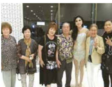
ニューハーフショーを親に行き来しました。さてこの中に男性は何名いるでしょうか?