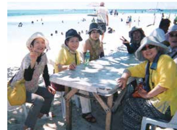
女性友だち6人の旅行!長野では見られない透明で雄大な海に感動!バーベキューを楽しみました!

女性友だち6人の旅行、不安と期待の中、成田空港を出発。pm7時にマクタン・セブ空港に到着。ドライバーさん、通訳さんが笑顔で出迎えて下さり、花や緑に囲まれた南国のリゾートに着き、メイドさん大勢に迎えられ、不安は半減し嬉しかったです。翌朝のテラスからの朝日、青空が海面に映り素晴らしく綺麗でした。会報を見て挑戦しようと思っていたパラセーリングとシーウォーカーが、天気も良く実行出来ました。長野では見られない透明で雄大な海に感動。海の中でのかわいくてピカピカ光っていた魚に会えて再び感動しました。昼にはメイドさんが作って下さったおにぎり、とても美味しくいただきました。急な変更にも笑顔で対応していただき感謝でした。島へ行ってバーベキューを楽しみ、マッサージを体験したり、ネイルまで出来て疲れが取れ、心が癒され満足しました。ニューハーフショーまで観に連れて行っていただき、舞台衣装に圧倒されました。旅の中3日間、よく笑い、楽しく過ごせました。ドライバーさん、通訳さん大変お世話になりました。感謝しています。ありがとうございました。