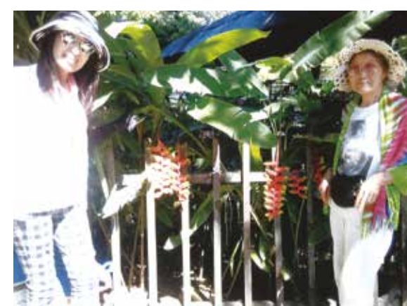
南国らしい花々やマイナスイオン溢れるセブでは、心身ともに活性化されて体中の細胞も喜んでるように感じます!

母親を含む長野県からのご一行と成田空港で合流し、総勢12名にて8泊9日の楽しい旅行となりました。今回、4度目、コーラルポイントリゾートに到着するなり「おかえりなさい!」。懐かしいスタッフの方々からのお出迎えを受けて「ただいま〜!」。いよいよ南国リゾートの始まりです。大海原を眺めながら、毎朝いただくフレッシュなマンゴー、パイナップル、バナナ、スイカは甘さが濃厚!! 格別な美味しさで、朝からとても幸せになります。母は風邪が、私は東京で辛い花粉症の症状が出ていましたが、マイナスイオン溢れるセブの大自然により、毎回、回復して元気一杯。島めぐりやオプションな観光を楽しんで、心身ともに活性化されて体中の細胞も喜んでるように感じます。何と言っても、80代の母が20代前半の可愛らしいメイドさんと一緒に少女のような笑顔ではしゃぎ、ポーズを取る姿がなんとも可愛くて、このまま時間が止まってくれたら...と思う程、幸せなひとときでした。また実家へ帰省した時に、写真を眺め思い出を語るのが楽しみです。あつという間の楽しい9日間、平成最後の春の良き思い出です。今回、同行させていただきました皆様、現地スタッフの方々、大変お世話になり感謝いたします。ありがとうございました。