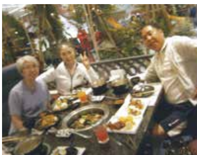
三年ぶりのセブ旅行がやっと実現! 妻と姉の三人で楽しい旅行ができ、スタッフの皆さんに感謝いたします!