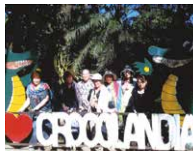
「幸せなひととき」をありがとう! 総勢12名、あつという間の楽しい9日間、平成最後の春の良き思い出です!

母親を含む長野県からのご一行と成田空港で合流し、総勢12名にて8泊9日の楽しい旅行となりました。今回、4度目、コーラルポイントリゾートに到着するなり「おかえりなさい!」。懐かしいスタッフの方々からのお出迎えを受けて「ただいま〜!」。いよいよ南国リゾートの始まりです。大海原を眺めながら、毎朝いただくフレッシュなマンゴー、パイナップル、バナナ、スイカは甘さが濃厚!! 格別な美味しさで、朝からとても幸せになります。母は風邪が、私は東京で辛い花粉症の症状が出ていましたが、マイナスイオン溢れるセブの大自然により、毎回、回復して元気一杯。島めぐりやオプションな観光を楽しんで、心身ともに活性化されて体中の細胞も喜んでるように感じます。何と言っても、80代の母が20代前半の可愛らしいメイドさんと一緒に少女のような笑顔ではしゃぎ、ポーズを取る姿がなんとも可愛くて、このまま時間が止まってくれたら...と思う程、幸せなひとときでした。また実家へ帰省した時に、写真を眺め思い出を語るのが楽しみです。あつという間の楽しい9日間、平成最後の春の良き思い出です。今回、同行させていただきました皆様、現地スタッフの方々、大変お世話になり感謝いたします。ありがとうございました。