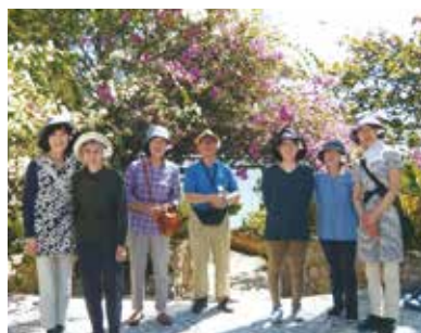
88才になる母の付添をしながら楽しめました!

初めてのセブ島旅行。88才になる母と兄、姉、姉のお友達7人で行って来ました。「母の付き添いをしながら楽しんで来れたら」と思い、すべておまかせ(姉とお友達は2度目だったので)の気楽な感じで行かせて頂く事が出来ました(色々ありがとう!!)。2日目はパンダノン島の白い砂浜で海的美しさを楽しんだり、ウェルカムランチでバーベキューを楽しみました。とっても美味しかったです!! 3日目はボホール島でランチクルーズ、チョコレートヒルズ、めがねザル、体長が10cm位で小さくてとっても可愛かったです。4日目はパラセーリング、シーウォーカー、などのマリンスポーツを楽しんで、最後にオイルマッサージをしてもらい身体も心も癒されました。天気にも恵まれ、通訳さん、運転手さん、メイドさん、大変お世話になり、楽しい思い出が作れました。ありがとうございました。セブ島は湿度が低く、ハワイのような気候でとても気持ちの良いすばらしい所だと思います。これからどんどん発展して、すばらしいリゾート地となる事でしょう!!