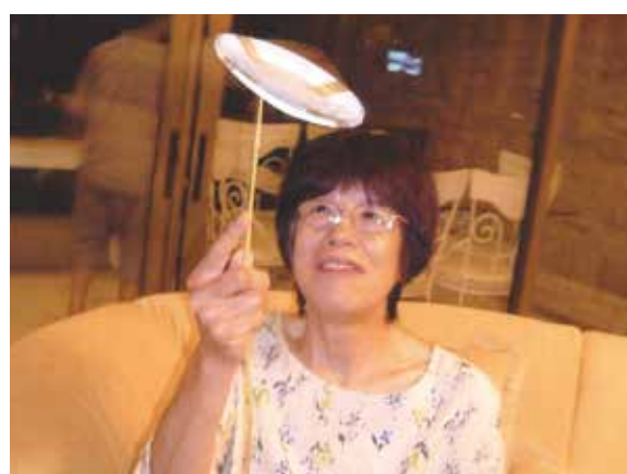
夜はウェルカムパーティーでゲームなどしながら、とっても楽しく過ごしました!

以前よりお誘い頂いていたセブの旅、新元号の発表を気にしながら、伊那から9名、上田より2名の仲間で7泊8日で行って来ました。コーラルポイントリゾートに着き、メイドさんの歓迎で美味しいマンゴージュースをいただきました。翌日からは、サファリ見学、マンゴー工場での買い物、夜はウェルカムパーティーでゲームなどしながら、とても楽しく過ごしました。3日目はバンカーボートに乗ってパンダノン島に行き、美しい海で童心に返って水遊び、貝殻拾い、バーベキューをし、キルトの島の『カオハガン』では念願のタペストリーを買うことができ、早速自宅の壁に飾り出ししています。次の日はセブ市内の教会見学後、カワサン滝を見学して、バディアンゴルリゾートへ。早朝にオスロブのジンベエザメウォッチングへ行きました。夜はメイドさんや生バンドの方とさよならパーティー。6日目も早朝にボホール島へ、メガネザル、川下りのクルージングランチ、円錐の形のチョコレートヒルズ。最終日前日はパラセーリング、カジノ見学。異国でのいろいろな体験、見学、素晴らしい方たちと御一緒させていただき、すべてが感動の旅でした。大変お世話様になりありがとうございました。セブはまだ発展途上で、貧富の差もありますが、おいしいパン、果物、ジュース、イカ、エビの料理、シニガンスープなど忘れられません。またの機会に旅が出来たらと思います。