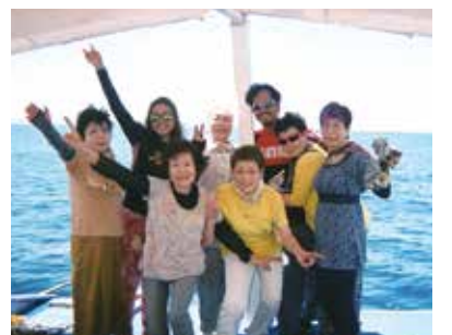
旅の中3日間、よく笑い、楽しく過ごせました。ドライバーさん、通訳さん大変お世話になりました!

女性友だち6人の旅行、不安と期待の中、成田空港を出発。pm7時にマクタン・セブ空港に到着。ドライバーさん、通訳さんが笑顔で出迎えて下さり、花や緑に囲まれた南国のリゾートに着き、メイドさん大勢に迎えられ、不安は半減し嬉しかったです。翌朝のテラスからの朝日、青空が海面に映り素晴らしく綺麗でした。会報を見て挑戦しようと思っていたパラセーリングとシーウォーカーが、天気も良く実行出来ました。長野では見られない透明で雄大な海に感動。海の中でのかわいくてピカピカ光っていた魚に会えて再び感動しました。昼にはメイドさんが作って下さったおにぎり、とても美味しくいただきました。急な変更にも笑顔で対応していただき感謝でした。島へ行ってバーベキューを楽しみ、マッサージを体験したり、ネイルまで出来て疲れが取れ、心が癒され満足しました。ニューハーフショーまで観に連れて行っていただき、舞台衣装に圧倒されました。旅の中3日間、よく笑い、楽しく過ごせました。ドライバーさん、通訳さん大変お世話になりました。感謝しています。ありがとうございました。