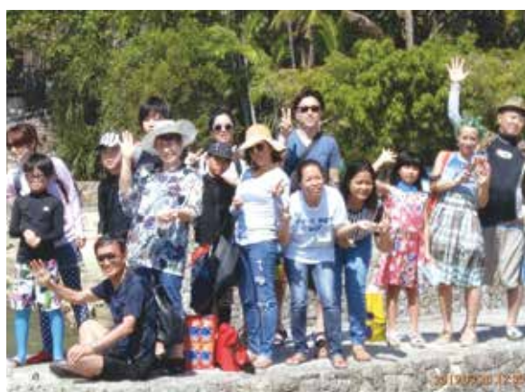
昨年より、3家族全員でセブへ行こう!!と大計画を立て、全員参加できました!!

昨年より娘たち3家族でセブに行こうと大計画を立てた。夫君たちはそれぞれ子供たちの為に仕事のやりくりをし、娘たちは家計のやりくりをし全員参加。いざセブ島へ!!セブは27℃と風もさわやかで快適、天気も上々。コーラルポイントリゾートの辺りはピンク・白のブーゲンビリアでいっぱい!気になる花・木々はまさに南国だ。プールに飛び込み子供達は朝早くから大はしゃぎ。メイドさんが見守ってくれて、親達ものんびりリフレッシュ。孫たちがキャーキャー言って呼び合う大きな声、笑い声。この健康と幸せを導いてくれた亡き父母に感謝です。船に乗ってパンダノン島へ。あの海の色は最高!BBQも美味だった。ギターを聞きながら又良い気分。シュノーケルして魚も追いかけたよ。マリンスポーツ、楽しくて楽しくて思い出しても笑っちゃうね。ジジ・バアバのジェットバイクすごかったでしょ?ペダルボートは大いに足の運動になったよ。堤防に座礁ばかりしてた。フライフィッシュ・バナナボート、手を振ってニコニコ出発したのに必死につかまっている孫達、頑張ったネ。何事も積極的に楽しい長女の夫君、アメージングショーでは忘れられないハプニングもあったとか。毎夜の大宴会は笑いの絶えないブレイメンの音楽隊でした。5年後には1人増えてまた来ようネ!と皆で約束。それまで元気で頑張ろう!ワールドビッグフォーに感謝です。スタッフの皆様ありがとうございました。稲田の御両親、本当にありがとうございました。