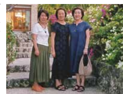
何十年来の友人にワールドビッグフォーを紹介してもらい、わずか数ヶ月でセブへ来ました!

初めての海外、それも今人気のセブ島!会員になってわずか数ヶ月、何十年来の友人に誘われて参加、ワールドビッグフォーを覚えてくれたのも彼女。現地時間19:30頃到着。機内から見たセブ空港の広さ明るさにビックリ!車の多さ、人の多さ(特に子供)に2度ビックリ。現地料理を堪能してコーラルポイントリゾートへ。遅い時間にもかかわらず、若いメイドさんが全員笑顔で歓迎。部屋の広さ、豪華さにまたまたビックリ。翌日、フットマッサージ、ショッピング、中華料理。夕方戻ると担当のメイドさんは、私の顔をしっかりと覚えてくれて、サッと荷物を持ち部屋へ。優雅な気持ちにさせて頂きました。次の日、無人島でバーベキュー、夕方、翌日帰る方のお別れ会も兼ねたパーティー、生バンドにメイドさん全員でダンス、同行の男性陣飛び入り参加。笑い有りのとても楽しいひと時でした。部屋で全身マッサージ(至福の時)。翌日英会話の学校訪問、とても環境良く充実した施設でした。マッサージと夕方、ニューハーフショー。最後の2日間はマッサージ、ショッピング、夜はメイドさんと女子会、楽しく会話。2月、3月は真夏で1番良い時期。子供が多いので、学校は午前と午後に分かれているとか。現地の言葉ビサヤ語を覚えてもらったり、笑いが絶えませんでした。本当に楽しかった!出発前からゆっくり、のんびり、毎日マッサージ。想いが叶った7日間、現地のスタッフ、ドライバーさん、通訳さん、メイドさん、ナリッパイミクー(お世話様)でした。そしてサラマット(ありがとう)