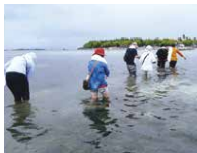
この時期は日本でいう大潮。浅くて船が島に近寄れない。海の中を歩いて行くことに!