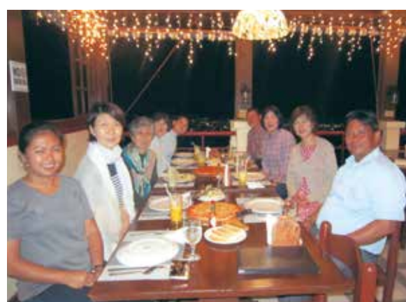
高台のレストランで夜景を眺めながらイタリア料理を楽しみ、リッチな気分を味わいました!