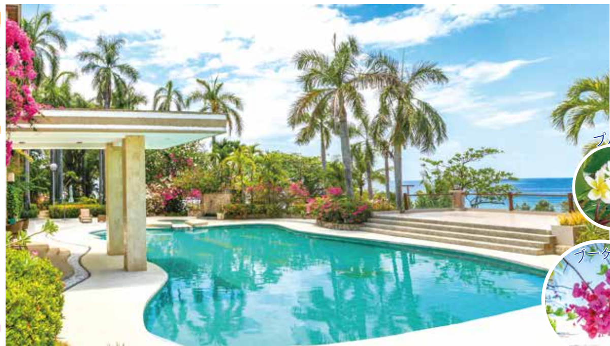
色彩鮮やかな南国の景観に佇む セブ島「ワールドビッグフォーリゾート」