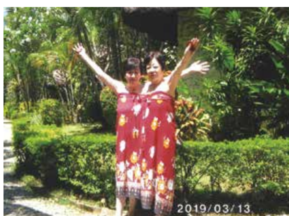
毎日エステ、買い物、マッサージと夢の様。天気も良くて最高!!

新潟はまだ寒いので、厚手の物を着用して出発しました。途中で1枚ずつ脱ぎ、マクタン・セブ空港に到着しました。コーラルポイントリゾートに着くと冷たいマンゴージュース、本当に美味しかったです。毎日マッサージ、ショッピングモールでの買い物、エステと楽しく過ごしました。昼夜の外食も口に合い、本当においしくいただきました。船に乗り、バーベキューに連れて行っていただき、夜は初めて見るニューハーフショーのあまりの綺麗さに驚きました。朝日が昇るきれいな海、ブーゲンビリアは咲き乱れ、A棟5階の部屋から見た景色は最高でした。生バンドの演奏、メイドさんの踊り、皆も一緒に踊り、楽しい一夜を過ごしました。メイドさん、運転手さん、スタッフの皆様、色々とお世話になり楽しい旅行を有難うございました。