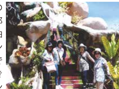
いろいろな体験、見学、素晴らしい方達と御一緒させていただき、すべてが感動の旅でした!

以前よりお誘い頂いていたセブの旅、新元号の発表を気にしながら、伊那から9名、上田より2名の仲間で7泊8日で行って来ました。コーラルポイントリゾートに着き、メイドさんの歓迎で美味しいマンゴージュースをいただきました。翌日からは、サファリ見学、マンゴー工場での買い物、夜はウェルカムパーティーでゲームなどしながら、とても楽しく過ごしました。3日目はバンカーボートに乗ってパンダノン島に行き、美しい海で童心に返って水遊び、貝殻拾い、バーベキューをし、キルトの島の『カオハガン』では念願のタペストリーを買うことができ、早速自宅の壁に飾り出ししています。次の日はセブ市内の教会見学後、カワサン滝を見学して、バディアンゴルリゾートへ。早朝にオスロブのジンベエザメウォッチングへ行きました。夜はメイドさんや生バンドの方とさよならパーティー。6日目も早朝にボホール島へ、メガネザル、川下りのクルージングランチ、円錐の形のチョコレートヒルズ。最終日前日はパラセーリング、カジノ見学。異国でのいろいろな体験、見学、素晴らしい方たちと御一緒させていただき、すべてが感動の旅でした。大変お世話様になりありがとうございました。セブはまだ発展途上で、貧富の差もありますが、おいしいパン、果物、ジュース、イカ、エビの料理、シニガンスープなど忘れられません。またの機会に旅が出来たらと思います。