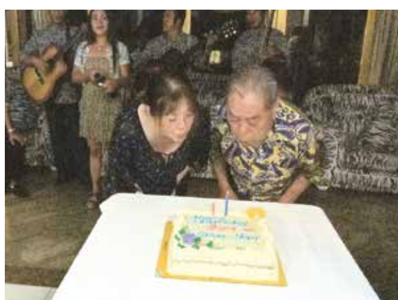
パーティーでは私の誕生日を祝って頂き、皆さんからケーキも出してもらいました!

今年も毎年楽しみにしていたセブ旅行に行ってきました。今年は総勢12名での旅でした。セブでのウェルカムドリンクのマンゴージュースから始まり、朝食で出る果物は相変わらず本当に美味しかったです。今年のパンダノン島ではスコールに遭いましたが、そのおかげであまり暑くなく、気持ち良く過ごせました。今、セブでは空港をはじめ、どんどん発展して新しいビルが建ち、街並みもだいぶ変わってきました。毎年どこか新しくなり、違った風景が楽しめます。パーティーでは誕生日ということで、ケーキも出してもらい、お祝いしてもらいました。ワールドビッグフォー様には本当に感謝感謝です。楽しい旅をありがとうございました。