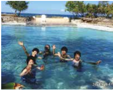
コーラルポイントリゾートの海水(温水)プールでも泳ぐことができ、人生初めての経験で感動しました!!