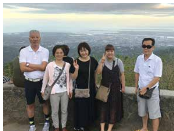
初めてのセブ島は友達家族5人で来てました。夕方トップスでこの後、夜景を楽しみました!

初めてのセブ島へ友達家族と5人で来ました。朝6時に家を出て、午後便でマクタン・セブ空港へ。夜コーラルポイントリゾートに着き、多勢のメイドさんとマンゴジュースで迎えてくれました。2日目は、7Dマンゴー工場ドライマンゴーをお土産として買い、シューマートモールで買物。道教寺院を見学後、ホットストーンマッサージでリラックス。夕方トップスで夜景鑑賞。3日目は高速船に乗り、ボホール島へ。チョコレートヒルズではあいにくの雨。