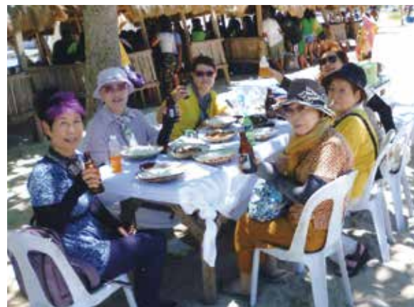
島めぐりへ行き、皆でビールでカンパイ!!イカ、魚、エビなどを焼いてもらいバーベキューを堪能しました!

4月18日から22日まで、4泊5日、6名でセブ島に行ってきた。2日目は島全体の休日に当たり、ほとんどの店が休みになってしまい、計画を練り直しました。私が一番に挑戦したかったパラセーリングはなんとか予約できました。飛ぶ位置まで向かった時、サービス?でスピードを出したり、バウンドさせたりしてくれたので、やや酔ってしまった。でも空高く飛んだ時は大変気持ち良かったです。その後はフラワーパークにも行きました。階段が多く、急な場所にあり、皆大変でしたが、満開のケイトウとひまわりの中で写真を撮りました。3日目は島めぐりです。船の中で撮った写真です。風がすごく強いのがこの写真に現れています。島に着くと、イカ、魚、エビなどを焼いてもらいバーベキューをしました。1時間くらい待つ間、泳いでと言われていたが、誰も泳がず、潮の匂い、風を感じながら待っていました。近くにあずまやが見えたので、砂をふみながらそこまで歩いて行き、写真を撮って来ました。マクタン島に戻った後は、ネイルのお店に行き、ひさしぶりに手足の爪もお手入れをもらい気持ちよかったです。あっという間の5日間でしたが、よい思い出になりました。