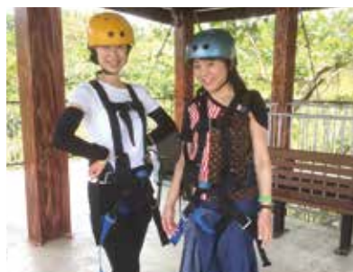
初めてジップラインに乗ってみました。谷の上をロープにつかまり風を受けて気持ち良かったです