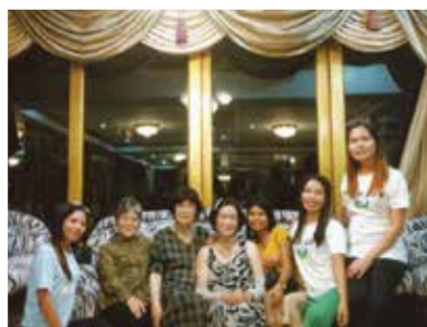
コーラルポイントリゾートのメイドさんたちの笑顔には本当に癒されます!メイドさんありがとう!