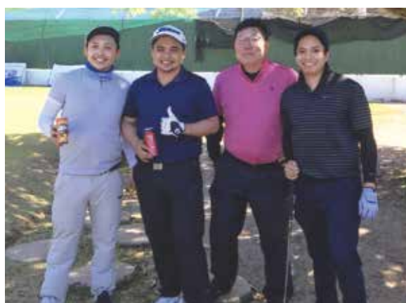
キャディーに恵まれコーチングを受けスイングを改善し、後半ハーフは6ホールパーでした!

昨年に続き、妻のダンス仲間とのセブ島への旅が実現しました。台風発生の情報もあり天候を心配していましたが、帰る日の朝に小雨が降った程度で直ぐ回復し、5日間は天気恵まれた癒しの楽しい旅となりました。空港到着後、イタリア料理を楽しみ、翌日からイベントに胸膨らませました。翌朝の朝早くリサさん(案内者)から、ゴルフの予約が取れたと電話が入り、急遽支度し、Mactan Island Golf Courseへ。大変混雑していたが、何とかフィリピンの若者3名の中に入れて頂きスタート。あいにくカートがなく小生だけ歩き、風があり涼しさを感じながらなんとか楽しくラウンド出来ました。フィリピンの若者3名も礼儀正しく違和感無く去年のセブカントリーと同様、キャディーに恵まれコーチングを受けスイングを改善し、後半ハーフは6ホールパーでした。3日目、前回と同様パンダノン島へ。途中海の中を妻たちが探索。小生、船の上でウキスキーを飲み癒し、到着後何種類かの貝を美味しく頂き、幸福感を感じ癒し・・・これぞ最高の癒し。夕食はメイドさんが作ってくれた料理に舌鼓を打ち、何よりも美味しく頂きました。4日目、土産の買い物をし、手足のネイルお手入れ、これも癒し・・・夜にはさよならパーティーを開催して頂き、豚の丸焼き・・・生バンドでダンスを楽しみ最高の気分、これまた癒し・・・あっという間に4日間が過ぎ、本年11月に3度目の再会を約束し、8名を残し5名が翌日帰路に着きました。