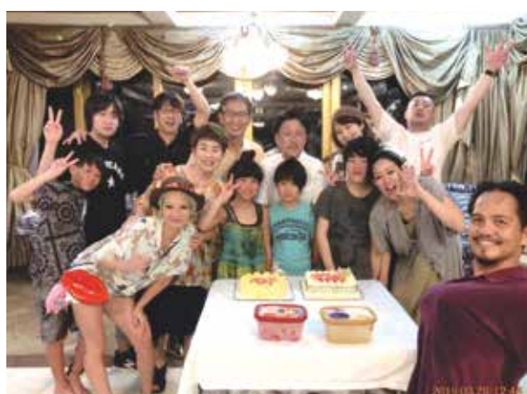
初めて触れた異国の文化と人々、言葉に子供達は多くの事を感じてくれた事でしょう!

花粉がピークの日本から、大気も海も澄み切った南国への5日間の旅へ。私と長男は13年振り3回目、主人と次男は初めてのセブ島へ。長年の父母の希望だった親族総勢13名全員揃った旅が実現した。13年前と変わらない蒼い海、カラフルな街並みは確実に発展を遂げ、活気に満ちていた。初めて触れた異国の文化、人々、言葉に子供達は多くの事を感じてくれた事でしょう。【以下、次男(8才)の感想です】『コーラルポイントにとまった。道ろにはジブニーがいっぱいで人がいっぱいだった。セブなのに日本りょうりがおいしかった。兄ちゃんはずしを食べ、ぼくは茶そばを食べた。パンダノン島へ行った。BBQをした。ぶた肉がおいしかった。海の水は青い所、水色、白いところがありすていきれいだった。白いところはさんごしょうがある所です。マリンスポーツをした。最初にバナナボートにのった。スピードが速くてジャンプしてすごい楽しかった。つぎにフライフィッシュにのった。スピードも速くてジャンプもして、兄ちゃんは2回もおちておもしろかった。おみやげを買いました。朝、いっしょに行っている友だちとピアノの先生にわたしたいです。道ろにひとはいっぱいいたけど、犬やニワトリも歩いていました。中学生になったらもう一度セブに来たいです。すごい楽しかった!』