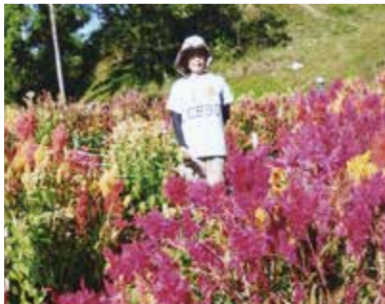
フラワーパークでは、満開のケイトウとひまわりの中で写真を撮りました!