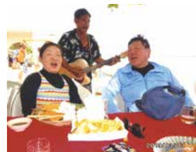
沢山の癒しを楽しみ、本年11月に3度目の再会を約束し帰ってきました!