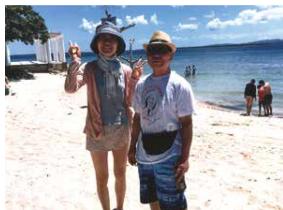
パンダノン島の白い砂浜で海的美しさを楽しんだり、ウェルカムランチでバーベキューを楽しみました