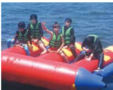
手を振ってニコニコ出発したのに必死につかまっている孫達、頑張ったネ!