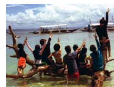
セブ最高!!海に向かって皆んなでピース♪

今回初めてフィリピン・セブ島に行きました。マクタン・セブ空港からコーラルポイントリゾートまでの道のりでは、地域によっていろいろな場所があると感じ、学ぶ事がたくさんありました。2日目はラプラプ公園に行き、日本では売ってない様なキレイな貝の置物やかわいいキーホルダーがあつてとっても楽しかったです。3日目は海がとても美しい島に行きました。一番に感じたのは、もぐった時に海の底まで見えた事と、泳いでいる魚がくっきり見えたことにびっくりしました。そこではキレイな写真が撮れて良かったです。4日目の夜はみんな一緒にパーティー。ダンスをしたり、唄ったり、とても楽しかったです。お父さんが誕生日だったのでサプライズケーキ。みんな笑顔で笑いが絶えない夜、最高でした。セブ最高!!