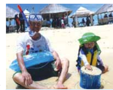
バーベキューが出来るまでジジ、ババは浅い海でシュノーケリング!孫は水遊び砂遊びが気に入ったみたいでした!

2回目のセブ、3月25日からの5日間、妻と2人でコーラルポイントリゾートの海見える1室、これに加えて娘と4歳の孫が同じく1室。2日目のパンダノン島は10時に船に乗って11時着。エメラルドグリーン的大海と真白な砂浜の南国の島でメイドさんがバーベキューの準備開始。娘と孫は砂浜で水遊び。ジジ、ババは浅い海でシュノーケリングを開始。孫は水遊び砂遊びが気に入ったみたいでした。12時頃バーベキューの準備もできて、椰子の木コテージで食べたイカが美味しかった。デザートはマンゴーも素晴らしい。食後はパパと孫が貝拾い。孫をパパに任せて娘はシュノーケリングを開始。良いポイントが見つかったのでジジも黄色の熱帯魚を見ることができました。砂浜との別れを流る孫をひっぱって、棧橋を離れる船の中での孫の寝顔は満足そうでした。3日目はセブ市内へ。午前中に土産物を買った後、道教寺院、サント・ニーニョ教会、サンペドロ要塞、山頂展望台トップス観光。18時ごろトップスに到着。市街地や夕焼けの写真撮影と夜景も楽しめました。孫は展望台のマス目の石の上を走って、渋滞の車内での疲れをとるとともに、帰りの車では熟睡。通訳さん、ドライバーさん、メイドさん達には本当に感謝しています。2回目のセブも"夢のような"旅行でした。