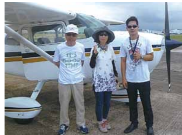
空中遊覧では別世界のような海と、ボホール島のチョコレートヒルズなど、素晴らしい景観を満喫しました!

念願叶って4回目のセブです。今回は主人も行く気満々で仲間に入れて頂き、夫婦で行ける喜びと感謝の旅でした。船上でバーベキューのおもてなしを受けながら向かったカオハガン島で目にしたものは、高床式住居、手洗い洗濯の風景、野放しの鶏、ヤギなど、そんな暮らしの中に笑顔の子供達の姿、幸せそうな人々の顔を見た時、全く異なる価値観の違いに驚きました。確かに青い海と緑の木々など自然の恵みが詰まっている贅沢な空間です。この島は日本人の所有者が「何もない豊かさ」と掲げておりますが、島民にとっては、家族に囲まれ自然に身を任せた“のんびり”とした生活。便利なものが何もないからこそ心豊かに感じているのでしょう。確かに車もないので交通事故の心配もなく、犯罪もなく、ストレスのない穏やかな生活の様です。このような幸福感もあるのですネー。我に顧みると物が豊富で情報豊かで便利な事を当たり前の様に思い生活していましたが、そのことにさらに感謝し、そして反省をします。離島時には、美しい海に魅了されていました。カメラに向けて思わず手を挙げ、ピースポーズをとりました。翌朝はセスナ機での空中遊覧で層を成した果てしなく続く別世界のような海と、ボホール島のチョコレートヒルズなど、素晴らしい景観を満喫しました。他にも楽しい事が盛沢山でしたが、感想は今回初体験の話に絞りました。セブは何回行っても感動し、学びを頂きます。お世話になった皆様、そしてワールドビッグフォーに感謝致します。