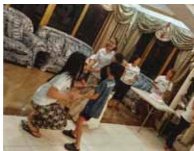
3年振りのセブ!皆さんの温かさは変わらず、ホッとしたひと時を過ごす事ができました!