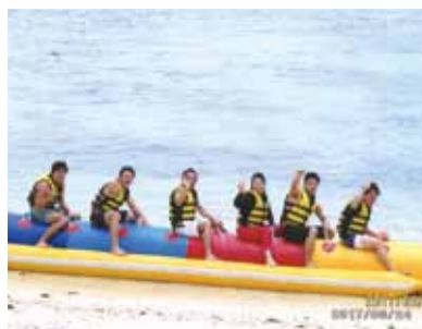
島に渡りビーチバレーにバーベキュー!!パラセーリングにおもいきりひっくり返ったバナナボートも最高でした!!