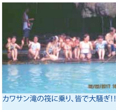
カワサン滝の筏に乗り、皆で大騒ぎ!!