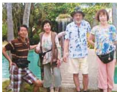
同行して下さい3人の方達は皆、神様の様な人達で毎日楽しく過ごせました♪