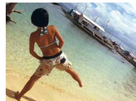
セブ最高!!海がとても美しい島では、魚がくっきり見えて感動!キレイな写真が撮れて良かったです!

今回初めてフィリピン・セブ島に行きました。マクタン・セブ空港からコーラルポイントリゾートまでの道のりでは、地域によっていろいろな場所があると感じ、学ぶ事がたくさんありました。2日目はラプラプ公園に行き、日本では売ってない様なキレイな貝の置物やかわいいキーホルダーがあつてとっても楽しかったです。3日目は海がとても美しい島に行きました。一番に感じたのは、もぐった時に海の底まで見えた事と、泳いでいる魚がくっきり見えたことにびっくりしました。そこではキレイな写真が撮れて良かったです。4日目の夜はみんな一緒にパーティー。ダンスをしたり、唄ったり、とても楽しかったです。お父さんが誕生日だったのでサプライズケーキ。みんな笑顔で笑いが絶えない夜、最高でした。セブ最高!!