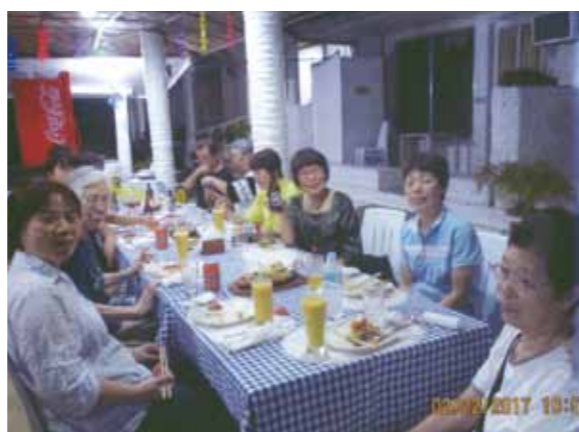
総勢11人での旅行!バディアンゴルフリゾートの野外で食事を堪能!

おとなしいジンベエザメですが、何頭ものサメが大きな口でエサを食べながら回遊する姿に感動!!朝4時の起床はきつかったけど、その甲斐がありました。その後、大きなココナツの実ジュースをストローで飲みましたが、すっきりとした甘みでとても美味しかった。セブに戻り昼食はイタリアン、夜はロブスター等の海鮮料理を堪能した。翌日、主人と息子はセブでゴルフ、私達はマリンスポーツを楽しみ、昼はゴルフ組と合流しバーベキュー。その後、家族でバナナボートを楽しみました。4泊5日、2回目のセブ旅行も終わり無事帰国しました。滞在中、お世話になりました皆様へ感謝しております。3回目はコーラルポイントリゾートでゆったりとした時間を過ごしたいと思っております。