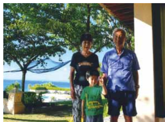
コーラルポイントリゾートの海見える絶景を満喫! 2回目のセブも"夢のような"旅行でした!

2回目のセブ、3月25日からの5日間、妻と2人でコーラルポイントリゾートの海見える1室、これに加えて娘と4歳の孫が同じく1室。2日目のパンダノン島は10時に船に乗って11時着。エメラルドグリーン的大海と真白な砂浜の南国の島でメイドさんがバーベキューの準備開始。娘と孫は砂浜で水遊び。ジジ、ババは浅い海でシュノーケリングを開始。孫は水遊び砂遊びが気に入ったみたいでした。12時頃バーベキューの準備もできて、椰子の木コテージで食べたイカが美味しかった。デザートはマンゴーも素晴らしい。食後はパパと孫が貝拾い。孫をパパに任せて娘はシュノーケリングを開始。良いポイントが見つかったのでジジも黄色の熱帯魚を見ることができました。砂浜との別れを流る孫をひっぱって、棧橋を離れる船の中での孫の寝顔は満足そうでした。3日目はセブ市内へ。午前中に土産物を買った後、道教寺院、サント・ニーニョ教会、サンペドロ要塞、山頂展望台トップス観光。18時ごろトップスに到着。市街地や夕焼けの写真撮影と夜景も楽しめました。孫は展望台のマス目の石の上を走って、渋滞の車内での疲れをとるとともに、帰りの車では熟睡。通訳さん、ドライバーさん、メイドさん達には本当に感謝しています。2回目のセブも"夢のような"旅行でした。