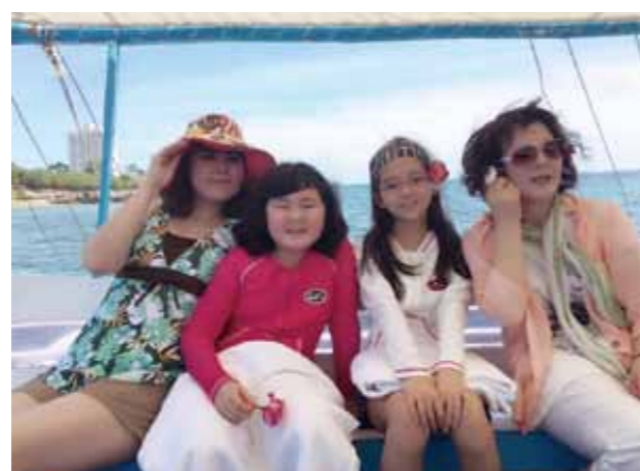
娘、孫達との夢のようなセブ島旅行、忘れられません!

娘、孫と三世代でのセブ旅行は最高に楽しく、夢のように美しい景色が忘れられません。また直ぐにでも行きたくになります。お料理がとてもおいしく、毎朝ミキサーの音で目が覚め、メイドさんがフレッシュな南国のフルーツでつくってくれるスムージーが最高に美味しかったです。朝の目覚めも良く、窓から見える朝日、そして南国の花の香り、ステキな部屋、いつまでも滞在したいと思うくらい心地が良かったです。パンダノン島の海は澄んでいてとてもきれいでした。お昼はバーベキュー。メイドさんが焼いてくださった海の幸やお肉の美味しさ、そして浜辺の優しい風にふかれながら食べた完熟マンゴークの味、香りが良く、甘くてジューシーで美味でした。ボホール島での川下り、途中でパフォーマンスもあり、お船からの景色やショーなどを楽しみながらの食事、最高でした。世界で最も小さなおさるさん、ターシャが可愛くて、癒されました。チョコレートヒルズは可愛らしいお山が沢山。200万年前、海底に存在していたのが、地上に上がってきて陸地になったという。4月から6月にかけて、草がチョコレート色に変わり、それを見たアメリカの政治家がアメリカのキスチョコに似ている事から名付けたという。なるほど!!いろいろな発見や、ワクワクやドキドキのセブ旅行。また娘や孫、沢山の友達を連れて行きたいと思いました。