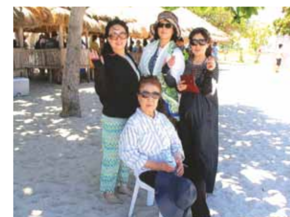
母を連れて、三人姉妹で海外旅行は初めてで、本当に本当に楽しませて頂きました!

姉夫婦が一年前から計画を立ててくれ、母の誕生日会も兼ねて、母を初めて海外旅行へ連れて行く事が出来ました。3人姉妹で海外へ行くのも初めての事です。仕事等の関係で家族全員の参加は出来ませんでした。今回は9名でセブ島を訪れました。夜の到着でコーラルポイントリゾートへ直行。かわいいメイドさん達が迎えてくれ、マンゴージュースのおもてなし。天気にも恵まれ、船で島へ行き、バーベキュー。海はとても美しく感動。パラセーリングも体験。他にも色々。なにより美しい日の出、青い海、きれいな花、美味しいフルーツに食事。やさしく親切な通訳さん、メイドさん、ドライバーさんに会えた事。忙しい日本の生活から、ゆったりのおんびりと癒しの旅行が出来ました。また頑張って仕事して、絶対にまたセブに来ますよ!本当に本当に楽しませて頂きました。ありがとうございます。