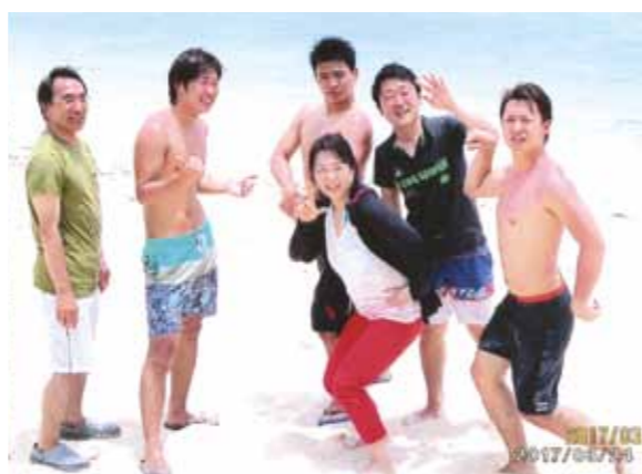
至福のひとつときをありがとうございました♪親戚の絆も一段と深まり、笑顔いっぱいの楽しい旅行となりました!

親戚といと達と初めての海外旅行がセブ島でした。出発の当日、朝まで大学のサークルの作業に追われ、慌しく集合場所の成田空港へ向かいました。車椅子の祖母、母、叔母、兄弟のような付き合いのいとこ達と無事に合流!! 春休みのイベントの一つが、セブ島への旅行でもありました。成田から4時間、マクタン・セブ国際空港に到着!!既に夜になっていました。コーラルポイントリゾートでは、A棟の1階をいとこ4人で独占し、広いリビングにゴージャスな部屋、まさしく世界の大富豪の別荘を堪能しました。朝食の時のフレッシュジュースの美味しいこと!!目の前にあるプールに毎日何度も飛び込んだこと!!初めてのガンシューティングに感激!!島に渡りビーチバレーにバーベキュー!!パラセーリングにおもいきりひっくり返ったバナナボート!!(笑)。ラプラプ公園でのマンゴーシェイクの美味しかったこと!!焼肉屋の美しい店員さんに、いとこ皆でほの字!!ディスコでナイトフィーバー!!セブ島最後の夜は皆で歌い踊り写真を撮り、とにかく盛り上がりました。まさしく元気になれる南国の楽園セブ島でした。至福のひとつときをありがとうございました。素敵な時間をプレゼントして下さいワールドビッグフォーのスタッフの皆様へ心から感謝しています。親戚の絆も一段と深まり、笑顔いっぱいの楽しい旅行となりました。