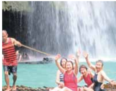
滝の下に入った時は、水圧で骨が折れるのではないかとと思う程の勢いでしたが、貴重な体験でした!(笑)