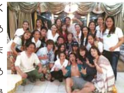
美しい自然、優しく親切なスタッフの皆様にあえたことが癒でした♪

姉夫婦が一年前から計画を立ててくれ、母の誕生日会も兼ねて、母を初めて海外旅行へ連れて行く事が出来ました。3人姉妹で海外へ行くのも初めての事です。仕事等の関係で家族全員の参加は出来ませんでした。今回は9名でセブ島を訪れました。夜の到着でコーラルポイントリゾートへ直行。かわいいメイドさん達が迎えてくれ、マンゴージュースのおもてなし。天気にも恵まれ、船で島へ行き、バーベキュー。海はとても美しく感動。パラセーリングも体験。他にも色々。なにより美しい日の出、青い海、きれいな花、美味しいフルーツに食事。やさしく親切な通訳さん、メイドさん、ドライバーさんに会えた事。忙しい日本の生活から、ゆったりのおんびりと癒しの旅行が出来ました。また頑張って仕事して、絶対にまたセブに来ますよ!本当に本当に楽しませて頂きました。ありがとうございます。