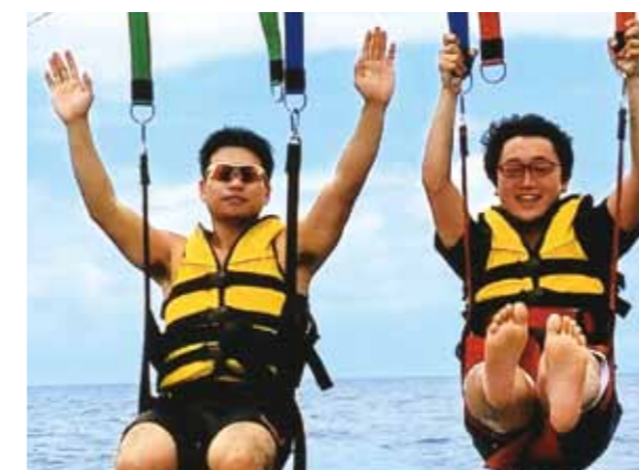
どの思い出もどの瞬間も「最高」とか「人生で一番」という言葉しか出てこない程楽しい時間でした!

3月22日から26日までの4泊5日で行った初のセブ島。4年前、父と兄が行っていた頃の写真や感想を聞いていた為、あらかじめ想像がついてはいたが…。行ってみたら想像以上の景色、待遇、心地よさで驚きました。ちょっと暑い気候でも気持ち良い海風があり、寒かった日本とは180度違い、始終過ごしやすくセブ旅行を楽しめました。セブ島に到着したのは夜。それに関わらず、コーラルポイントリゾートに着いたらまず部屋探索、記念撮影。従兄弟4人で落ち着く間もなく部屋から見えるプールへ飛び込み。夜は豪華なベッドは使わず、ベランダで風を感じながら一休み。ただ気持ちよくて寝ちゃったんですけどね(笑)。次の日から中3日はとにかく遊び尽くし。島巡り、興味深々だった射撃、ショッピング、きれいな景色を360度見渡せたパラセーリング、ひっくり返されたバナナボート、BBQ、白熱したビーチバレーに焼き肉パーティー、メイドさん、運転手さんも交えたパーティー…。どの思い出もどの瞬間も「最高」とか「人生で一番」という言葉しか出てこない程楽しい時間でした。正直、このセブ旅行を経験してしまったら他の旅行は…(汗)と思ってしまう程です。ぜひ多くの方にこの理想ともいえる「最高」の経験をして欲しいです。自分ら従兄弟は帰りの電車の中で「次いつ行けるだろう…最低年1回はセブに行きたいよね…」と話が盛り上がったので、またセブ島に行くでしょうね(笑)。