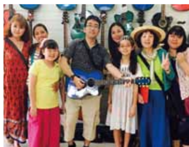
ギター工場をまわり、きれいな青いギターに一目ぼれし、ゲットしました♪