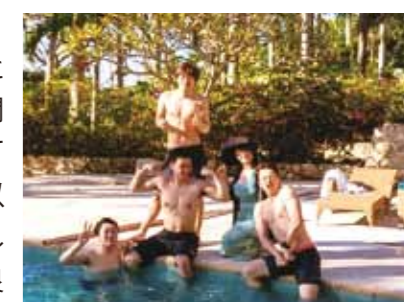
ぜひ多くの方にこの理想ともいえる「最高」の経験をして欲しいです♪

3月22日から26日までの4泊5日で行った初のセブ島。4年前、父と兄が行っていた頃の写真や感想を聞いていたが…。行ってみたら想像以上の景色、待遇、心地よさで驚きました。ちょっと暑い気候でも気持ち良い海風があり、寒かった日本とは180度違い、始終過ごしやすくセブ旅行を楽しめました。セブ島に到着したのは夜。それに関わらず、コーラルポイントリゾートに着いたらまず部屋探索、記念撮影。従兄弟4人で落ち着く間もなく部屋から見えるプールへ飛び込み。夜は豪華なベッドは使わず、ベランダで風を感じながら一休み。ただ気持ちよくて寝ちゃったんですけどね(笑)。次の日から中3日はとにかく遊び尽くし。島巡り、興味深々だった射撃、ショッピング、きれいな景色を360度見渡せたパラセーリング、ひっくり返されたバナナボート、BBQ、白熱したビーチバレーに焼き肉パーティー、メイドさん、運転手さんも交えたパーティー…。どの思い出もどの瞬間も「最高」とか「人生で一番」という言葉しか出てこない程楽しい時間でした。正直、このセブ旅行を経験してしまったら他の旅行は…(汗)と思ってしまう程です。ぜひ多くの方にこの理想ともいえる「最高」の経験をして欲しいです。自分ら従兄弟は帰りの電車の中で「次いつ行けるだろう…最低年1回はセブに行きたいよね…」と話が盛り上がったので、またセブ島に行くでしょうね(笑)。