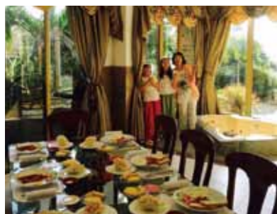
毎朝、ミキサーの音で目が覚め、起きるとメイドさんが朝食を準備してくれています♪