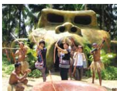
一期一会、本当に楽しかったセブ旅行。また機会をみて、命の洗濯に皆でセブにレッツGO!!

友達に誘われて、「セブに行こう!」と会員になった私。セブがどこにあるかも解らず、まずはネットで探してからスタートです。関西空港から一路セブに到着。南国の雰囲気忙しい日々を忘れて楽しもうと思いましたが、着いたのが夜で、専属の通訳兼ガイドさんとドライバーさんについていただき、さっそくレストランでフィリピン料理を堪能しました。ビールが美味しかった。今回の宿泊地コーラルポイントリゾートのビラに着くと、かわいい笑顔のメイドさんが言葉も片言で私達のお世話をしてくださいました。部屋の素敵な事、一人でこの部屋は贅沢で広すぎる。皆でお喋り三昧で夜を明かしました。さっそく次の日から市内に繰り出し、歩いて歩いても飽きないショッピング。夜は大笑いのアメージングショー。男性の綺麗な事!3日目はボホール島めぐり。いよいよ待望の海水浴。何年ぶりかの海遊びに皆大はしゃぎ。昼のバーベキューの美味しかった事!!次の日からはコーラルポイントリゾートの施設内でリゾート気分を満喫しようと、ゆっくりのんびり気楽に過ごし、エステにオイルマッサージにと心身共に癒されました。お別れパーティーでは、生バンドに唄、スタッフの方々によるダンスで皆大盛り上がりのおもてなしに大感激でした。今回の旅行で初めて出会った方々、皆様方の仲間入りをさせていただき感謝の気持ちでいっぱい帰路につきました。一期一会、本当に楽しかったセブ旅行。また機会をみて、命の洗濯に皆でセブにレッツGO!!次はジンベエザメを見たいです。本当にありがとうございました。