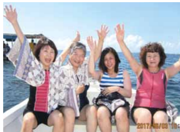
船の上でのバーベキューや泳ぎも楽しめました! お天気にも恵まれ、幸せいっぱいのセブでした!

初めてのセブ島2人を含め、4人の参加でした。私は3度目のセブだったので、お米を持参、ごはんを炊いて貰い、みそ汁と一緒にいただいた朝食はとても美味しかったです。カワサン滝は遠いのでバディアンゴルフリゾートに泊まり、川沿いを30分歩き筏に乗り、滝の下に入った時は、水圧で骨が折れるのではないかとと思う程の勢いでしたが、貴重な体験でした。シーウォーカーも体験しました。白い砂浜の無人島で船を止め、船上バーベキューをしたり、船の上から海に飛び込み皆で泳ぎました。お天気に恵まれた5日間があっという間に過ぎ、最後のお別れにはマルコポーロホテルでの食事。幸せいっぱいのセブでした。大勢の現地スタッフの皆様を支えられ、良い思い出が増えました。ありがとうございました。また行きたいです!