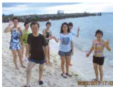
カモテスリゾートへの予定を変更してバディアンゴルフリゾートへ。近くの白い砂浜です!