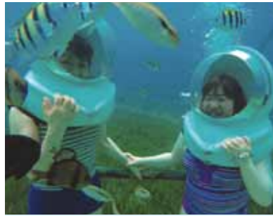
ずっと憧れていたマリンスポーツ、最初は緊張しましたが安心して楽しめました!