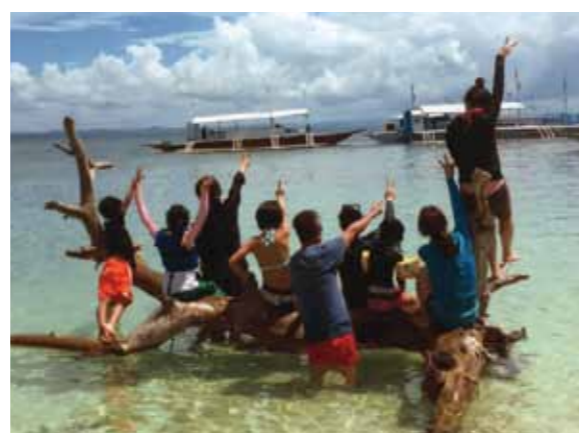
今回4回目のセブ旅行もとても充実した5日間でした!大好きなセブ、また来たいと思います!

今回4回目のセブ旅行でした。前回行った時は3年前。3年ともなるとセブの雰囲気も少しずつ変わっていきびっくりしましたが、セブの皆さんの温かさは変わらず、ホッとしたひと時を過ごす事ができました。今回は天候にも恵まれ美しい海を見たり、綺麗な島へ行ったりと、とても充実した5日間でした。美味しいマンゴーやお料理、船で島へ行き、街ではショッピングもして、2日目の夜にはパーティーもして頂き、バンドの生演奏など、あつという間の時間でした。久しぶりのセブでしたが、いつもと同じ様に安心して滞在でき、外へ出かける時も通訳さんやドライバーさんが付いて来て下さり、お陰様でトラブルもなく楽しく過ごす事が出来ました。メイドさん達にも親切にして頂き、前からメイドさん達にも覚えていただいていた、本当に嬉しかったです。大好きなセブ、また来たいと思います。ありがとうございました。