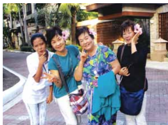
忙しい日々を忘れて楽しめました! かわいい笑顔のメイドさん達お世話いただき贅沢な時間でした!

友達に誘われて、「セブに行こう!」と会員になった私。セブがどこにあるかも解らず、まずはネットで探してからスタートです。関西空港から一路セブに到着。南国の雰囲気忙しい日々を忘れて楽しもうと思いましたが、着いたのが夜で、専属の通訳兼ガイドさんとドライバーさんについていただき、さっそくレストランでフィリピン料理を堪能しました。ビールが美味しかった。今回の宿泊地コーラルポイントリゾートのビラに着くと、かわいい笑顔のメイドさんが言葉も片言で私達のお世話をしてくださいました。部屋の素敵な事、一人でこの部屋は贅沢で広すぎる。皆でお喋り三昧で夜を明かしました。さっそく次の日から市内に繰り出し、歩いて歩いても飽きないショッピング。夜は大笑いのアメージングショー。男性の綺麗な事!3日目はボホール島めぐり。いよいよ待望の海水浴。何年ぶりかの海遊びに皆大はしゃぎ。昼のバーベキューの美味しかった事!!次の日からはコーラルポイントリゾートの施設内でリゾート気分を満喫しようと、ゆっくりのんびり気楽に過ごし、エステにオイルマッサージにと心身共に癒されました。お別れパーティーでは、生バンドに唄、スタッフの方々によるダンスで皆大盛り上がりのおもてなしに大感激でした。今回の旅行で初めて出会った方々、皆様方の仲間入りをさせていただき感謝の気持ちでいっぱい帰路につきました。一期一会、本当に楽しかったセブ旅行。また機会をみて、命の洗濯に皆でセブにレッツGO!!次はジンベエザメを見たいです。本当にありがとうございました。