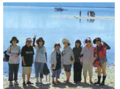
カオハガン島では、自然に身を任せた“のんびり”とした生活を垣間見て、美しい海に魅了されていました!

念願叶って4回目のセブです。今回は主人も行く気満々で仲間に入れて頂き、夫婦で行ける喜びと感謝の旅でした。船上でバーベキューのおもてなしを受けながら向かったカオハガン島で目にしたものは、高床式住居、手洗い洗濯の風景、野放しの鶏、ヤギなど、そんな暮らしの中に笑顔の子供達の姿、幸せそうな人々の顔を見た時、全く異なる価値観の違いに驚きました。確かに青い海と緑の木々など自然の恵みが詰まっている贅沢な空間です。この島は日本人の所有者が「何もない豊かさ」と掲げておりますが、島民にとっては、家族に囲まれ自然に身を任せた“のんびり”とした生活。便利なものが何もないからこそ心豊かに感じているのでしょう。確かに車もないので交通事故の心配もなく、犯罪もなく、ストレスのない穏やかな生活の様です。このような幸福感もあるのですネー。我に顧みると物が豊富で情報豊かで便利な事を当たり前の様に思い生活していましたが、そのことにさらに感謝し、そして反省をします。離島時には、美しい海に魅了されていました。カメラに向けて思わず手を挙げ、ピースポーズをとりました。翌朝はセスナ機での空中遊覧で層を成した果てしなく続く別世界のような海と、ボホール島のチョコレートヒルズなど、素晴らしい景観を満喫しました。他にも楽しい事が盛沢山でしたが、感想は今回初体験の話に絞りました。セブは何回行っても感動し、学びを頂きます。お世話になった皆様、そしてワールドビッグフォーに感謝致します。