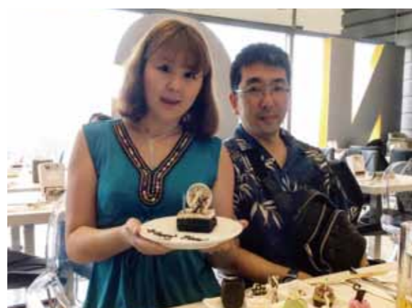
仕事の関係で二日の滞在でしたが、全てが大満足でした!

初めてのセブ。どんな旅行になるのかワクワクで参加しました。私は仕事で上海から帰ってすぐのフライト。先に娘達と嫁さん、義母が待つセブ島へ。滞在は二日間と短かったけど、ドライバーさん、通訳さん、メイドさん達の気配りのおかげ様で、大満足な旅行となりました。セブはギターが有名なので、工場に行きたいと伝えると、工場を何軒かまわってくれました。すごくきれいな青色のギターに一目ぼれし、ステキなギターをゲットする事ができました。青い海、白い雲、水平線を眺めながらのプール。そして毎日マンゴー三昧、全てが大満足。娘達二人も喜びプールで遊ぶ姿に、普段の仕事の疲れも吹っ飛びました。マンゴー工場やショッピングモールも楽しめました。食事もお酒も美味しく大満足。また皆で行きたいと思いました。セブ最高!本当に最高の思い出になりました。有難うございました。