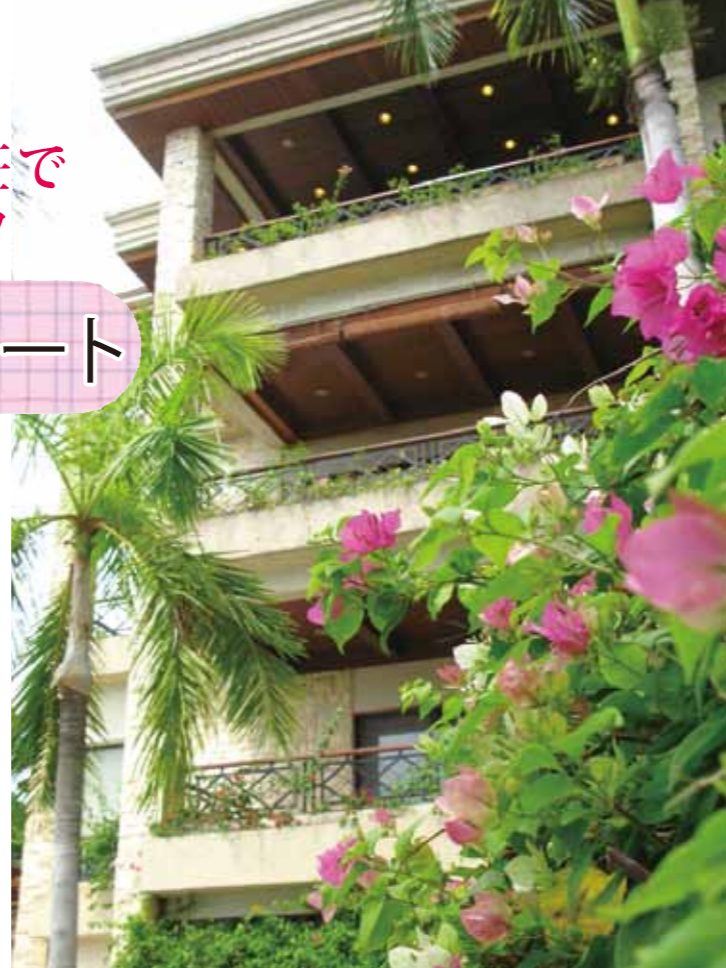
マクタン島の北端に優雅に佇むコーラルポイントリゾート 豪華絢爛 13 ユニット・10 リビング・寝室 27 部屋を所有

セブ島へ訪れると、まず目に飛び込んで来るのが現地の子供たちの明るい笑顔。美しい自然と海に育まれながら生きる純朴で陽気な人々の暮らしを垣間見ること、セブ渡航の楽しみのひとつです。家族や年配者を敬う国民性は、どこか懐かしい昔の日本を思わせる温かな情景に溢れています。