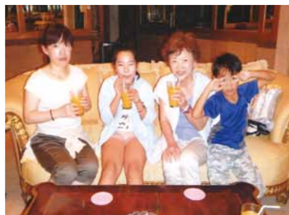
すべてが楽しかったセブ旅行、マンゴスチンに感激! やはり、セブに行ったら日本では味わえないフルーツを食べるべきだと思いました

今回は2度目のセブで、今回もとっても楽しむことができました。私は今回、フルーツスタンドに毎日のように通って、新鮮で甘〜いフルーツをたくさん食べました。特に気に入ったフルーツはマンゴスチンです。おばあちゃんに「おいしいよ!」教えてもらって食べてみると、プルプルの果肉で、本当においしかったです。やはり、セブに行ったら日本では味わえないフルーツを食べるべきだと思いました。そして今回は初めてスパに行ってみました。お母さんと、おばあちゃんと私で受けたのですが、着替えの服がとってもかわいくて良かったです。私が一番良かったと思うのは足のマッサージで、むくみがすべてとれて、ツルツルになりました。そして、ミルクバスでは、ちょうどいい温度で肌もスベスベになりました。疲れがすべてとれました。スパで一番心に残っているのは、体のマッサージをしてもらったときに、おなかもマッサージしてくれたのですが、それが、まだ子供の私にはくすぐったくて、大きい声で笑ってしまいました。でも、スパは初体験で、本当に気持ち良かったです。海もとってもきれ