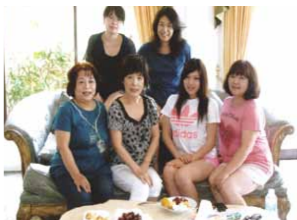
心に残るセブ旅行、至れり尽くせりの心のおもてなしに感謝！素晴らしい旅、どれを思い出してもステキな1ページです

会員になってまだ4ヵ月の私が、セブ旅行に参加する事になって、自分でも驚いています。決まった早々、キャリーケースを出してルンルン気分で行先へ出発しました。海の中を魚と一緒に戯れてみたい！うっとりするようなマッサージを受けてみたい！おいしい果物もたくさん食べたい！たくさんの期待感の中で旅立ちました。思っていた通り、素晴らしい旅となりました。青い海に浮かぶ美しい島々、ヤシの実、バナナ、ジャックフルーツのたわわに実る路地、プルメリア、ブーゲンビリア、ハイビスカス、様々な蘭の花々の咲き乱れるお庭、どれを思い出してもステキな1ページです。そして送り迎え、お洗濯、島巡り、パーティー、至れり尽くせりの心のおもてなし、感謝です。帰りの飛行機の中、隣に座った笑顔のステキなビジネスマン？とてもステキな香り、ついウトリまどろんでしまいました。旅のしめくくりの心の休日となりました。こんな素晴らしい旅の機会を私に下さった皆様、ありがとう。そして、お世話して下さいましたスタッフの方々、是非近いうちに、お友達と訪れたいなという希望を胸に、旅を終える事ができました。ありがとうございました。