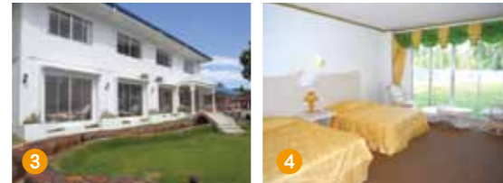
①・② 大海原を臨むプール・展望露天風呂 ③ 遮るものが何もない大パノラマが広がるホテル新館の外観 ④ 快適な滞在を約束するホテル新館ツインルームの清潔な室内