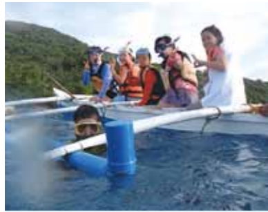
今回もステキなセブでした! ジンベイザメ餌付けの海へ、大きすぎて全体像が解らない程、大迫力の映像を見ている様でした