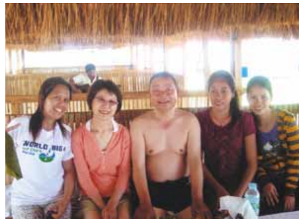
結婚35年記念のフルムーン旅行! 滞在中はショッピング、島巡り、美味しい珍しいお料理、フルーツ等沢山堪能させていただきました

結婚35年記念のフルムーン旅行にと、思い切って4泊5日のワールドビッグフォーセブリゾートに夫と共にやって来ました。フィリピンは雨季に入っているにもかかわらず、この5日間はお天気も良く、最高に快適な日々を送ることが出来ました。事前の知識は何もなく、フィリピンの国の様子も知らないまま、多少の不安を胸に入国した私たちでしたが、まず出迎えてくれたガイドのリサさんの優しさにホッと、超過密交通状況の中をすり抜ける運転さばきのドライバーさんに感動し、コーラルポイントリゾートまで着きました。大勢のかわいいメイドさん達に出迎えられ、案内されたお部屋の素晴らしいこと! 日常とは掛け離れたゴージャスな空間とサービスに「本当に来て良かった」と、主人共々幸せ気分になりました。それはまだまだ序の口で、滞在中の3日間、ショッピング、島巡り、サロンでのリラックスタイム、セブ料理を始めとする美味しいお料理、どれも最高の甘みと香りのフルーツ、そして今までに味わったことのない美味しいアイスクリーム! 沢山堪能させていただきました。フィリピン、セブ、マクタン、ワールドビッグフォーありがとう! まだまだ発展途上であるフィリピン国民の皆さんの幸せを心から願います。