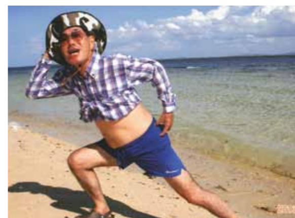
「珠玉の時間がたおやかに流れる」それがセブだ! こころを込めて「ありがとうセブ島、そして同行の仲間たち...」

旅の醍醐味を満喫する条件、それは「何処へ行くか?」ではなく、誰と行くか?」である。これは70歳の私が趣味として来た長い旅行人生で一貫して主張して来た旅のポリシーであります。旅は即ち「誰と行くか」が最優先課題であり「何処へ行くか」の旅の目的地は第二選択肢でありました。しかし今般セブ島を訪れてみて、このセオリーを大幅に修正しなければならぬ時がついに来たか、の感じみじみ...。私は今回が初めての参加、同行メンバーは計6名、ほとんどの方が初対面。どちらかと言うと私は「人見知りの激しいヘンなおっさん」タイプ人間。しかし滞在した7泊8日で、それはそれはみんな打ち解けザンマイ、10年来の旧知の間柄を更に超えて「刎頸の交わり」に近い高密度の人間関係が構築できました。その背景にあったもの、それはセブの庄巻の大自然、島民の純朴な国民性、コーラルポイントリゾートのメイドさんの心温まる日本人も真っ青なおもてなし、更に男女を問わず全ての年代の旅人を歓喜なまでに愉しませるマリンスポーツの充実、そして何よりもエステやダンス、それにカジノなど、人間の快楽本能をくすぐる魔性の魅力がこの島には満ち満ちていたから、にほかありません。そうです! セブ旅行に限っては「誰と行くか」の同行者選択は初対面者同士でも全く異論なし。旅の第一選択肢は「先ずセブ島ありき」でOK、この際、「誰と行くか」は、セブに限って第二選択肢に降格されても何の問題はありません。但し、これは私にとって旅のポリシーを見直す、自分史の大事件ではありますが...。いつもの仲間よし、ファミリーもよし、恋人同士は更によし、勿論夫婦もよし、それに一人旅だって、いやいや、見ず知らずの者同士だって即竹馬の友。すべての旅人を分け隔てなく受け入れ、それこそ旅の初心者も、エキスパートも、人それぞれの旅の価値観を大きく覆す「珠玉の歓喜と悦楽の時間がたおやかに流れる」まさにそんな卓越した安堵空間がこのセブには限りなく広がっています。こころを込めて「ありがとうセブ島、そして同行の仲間たち...」