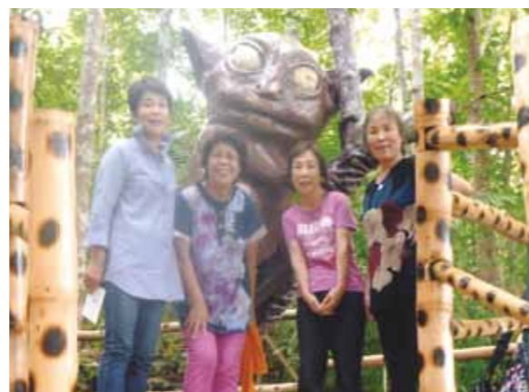
6年ぶり4度目のセブは心身共にいやされました! 初めてのボホール島では食事しながらロボク川下り、日本の歌を歌ってくれて楽しかったです

待ちに待ったセブ島へ30分遅れて成田を出発。足のケガで行きそびれて、6年ぶり4度目のセブは道路が整備され、大きな建物が多くなった感じ。4人のメンバーでパラセーリングとJWBホテルのエステ、海岸でのバーベキュー。今回はバディアンゴルリゾートで1泊し、カワサン滝ではいっぱいの滝に打たれ修行? パニック状態でした。でもマイナスイオンがいっぱいです。道中青く澄んだ川の流れの両岸に大きなヤシの木といろいろな花とのコラボは心をいやされました。パラセーリングは是非やりたいと思いチャレンジしてみました。「恐いなあ〜」と思ったけど鳥になった一瞬です。ボホール島へは初めて、田んぼがたくさんあり、かかしがあり、走る道路にはみ出してお米が干してありました。車がよけて走ります。のどかですネ! 食事しながらロボク川下り、日本の歌を歌ってくれて楽しかったです。子供たちのイベント踊り可愛かったです。いっぱい走ってくれてガイドさん7日間ありがとうございました。セブの海は何回行っても青くきれいな、大事にしたいです。