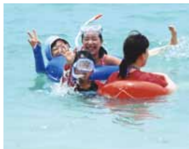
海もとってもきれいなので、大満足のセブでした! 初体験のスパでは足のマッサージが最高、本当に気持ち良かったです