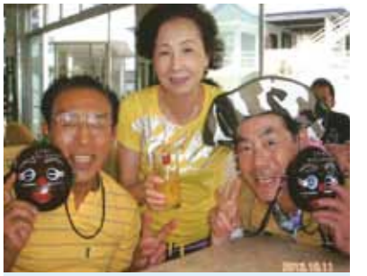
セブの庄巻の大自然、島民の純朴な国民性に真っ青! 人間の快楽本能をくすぐる魔性の魅力、旅の第一選択肢は「先ずセブ島ありき」でOK

旅の醍醐味を満喫する条件、それは「何処へ行くか?」ではなく、誰と行くか?」である。これは70歳の私が趣味として来た長い旅行人生で一貫して主張して来た旅のポリシーであります。旅は即ち「誰と行くか」が最優先課題であり「何処へ行くか」の旅の目的地は第二選択肢でありました。しかし今般セブ島を訪れてみて、このセオリーを大幅に修正しなければならぬ時がついに来たか、の感じみじみ...。私は今回が初めての参加、同行メンバーは計6名、ほとんどの方が初対面。どちらかと言うと私は「人見知りの激しいヘンなおっさん」タイプ人間。しかし滞在した7泊8日で、それはそれはみんな打ち解けザンマイ、10年来の旧知の間柄を更に超えて「刎頸の交わり」に近い高密度の人間関係が構築できました。その背景にあったもの、それはセブの庄巻の大自然、島民の純朴な国民性、コーラルポイントリゾートのメイドさんの心温まる日本人も真っ青なおもてなし、更に男女を問わず全ての年代の旅人を歓喜なまでに愉しませるマリンスポーツの充実、そして何よりもエステやダンス、それにカジノなど、人間の快楽本能をくすぐる魔性の魅力がこの島には満ち満ちていたから、にほかありません。そうです! セブ旅行に限っては「誰と行くか」の同行者選択は初対面者同士でも全く異論なし。旅の第一選択肢は「先ずセブ島ありき」でOK、この際、「誰と行くか」は、セブに限って第二選択肢に降格されても何の問題はありません。但し、これは私にとって旅のポリシーを見直す、自分史の大事件ではありますが...。いつもの仲間よし、ファミリーもよし、恋人同士は更によし、勿論夫婦もよし、それに一人旅だって、いやいや、見ず知らずの者同士だって即竹馬の友。すべての旅人を分け隔てなく受け入れ、それこそ旅の初心者も、エキスパートも、人それぞれの旅の価値観を大きく覆す「珠玉の歓喜と悦楽の時間がたおやかに流れる」まさにそんな卓越した安堵空間がこのセブには限りなく広がっています。こころを込めて「ありがとうセブ島、そして同行の仲間たち...」