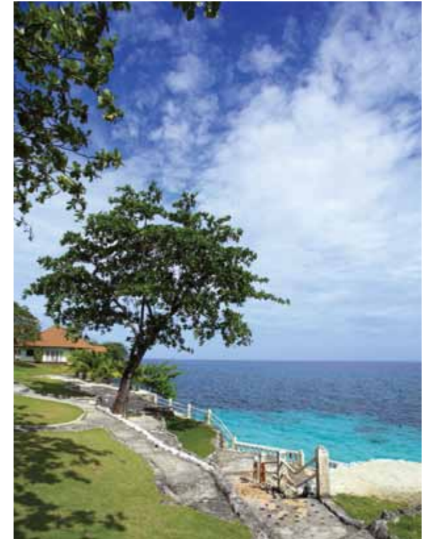
手付かずの自然が残るカモテスリゾート、スタービーチ