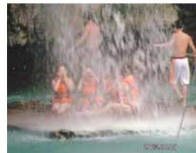
マイナスイオンがいっぱいカワサン滝、パラセーリングにもチャレンジ! セブの海は何回行っても青くきれいな、大事にしたいです