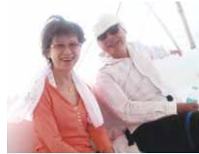
「本当に良かった」と、主人共々幸せ気分! 5日間はお天気も良く、最高に快適な日々を送ることが出来ました。セブありがとう