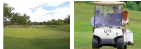
18ホール・シーサイドゴルフコースを完備