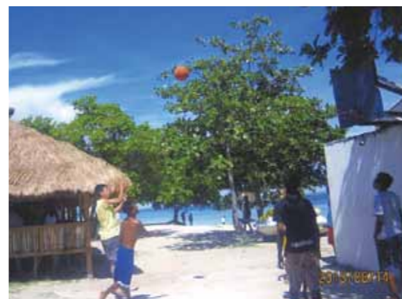
パンダノンアイランドではバスケ、凄く楽しかった！「いや～やっぱり外人強ええ・・・！」でも点を決められてよかった

初めての海外、僕はドキドキしていた。正直、海外は少し不安だった。だが、実際行ってみると日本にはない空気や建物を見て、「ああセブについて来たんだ」と実感した。まずセブでやったことは島巡り！夜に空港について、そのままコーラルポイントリゾートに行ったので、外の様子がまったく分からなかった。まず、驚いたことは信号があまりないこと。みんな車はストレスで通って行って、凄くビビった。あともう一つ驚いたことは、どこへ行っても人が多いこと。暑苦しかったけど、東京よりマシだった。次はパンダノンアイランドに行った。バスケをやっている人に会い「Hey! You! カモン!」と言われて、初めて外人とバスケをやった。「いや～やっぱり外人強ええ・・・！」でも点を決められてよかった。凄く楽しかった！次はダイビング！やってみて思ったことは、テレビで見るのと全然違った。凄い新世界だった！見たことのない魚やサンゴ・・・もう凄い大興奮でした。本当にフィリピン・セブ島に来てよかったと心からそう思った。家族のみんなで楽しめたのでよかった。また行きて～よ！！また連れて行ってほしいです！以上！