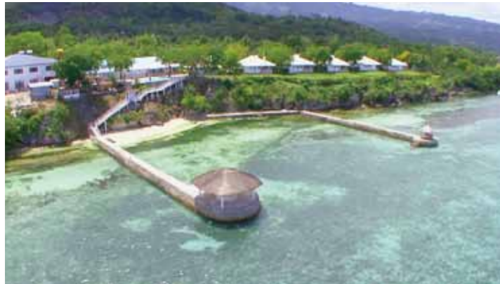
ホテル新館 14 室、保養所 6 室を完備するバディアンゴルフリゾート