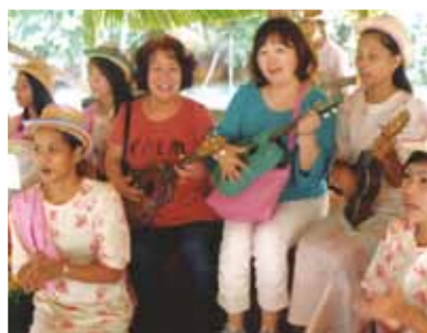
青い海に浮かぶ美しい島々、咲き乱れる南国の花々を満喫！お友達と訪れたいなという希望を胸に、旅を終える事ができました