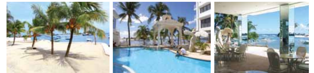
プールの前はプライベートビーチ リハビリに適した温暖な気候 清潔で開放的なレストラン