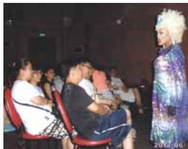
市内観光やショッピング、アメージングショーも楽しみました！知り合いの方とのパーティーもとっても楽しかったです