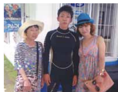
初めての海外、大興奮のセブ旅行！家族のみんなでお楽しみだったのでよかった。また行きて～よ！！また連れて行ってほしいです！

初めての海外、僕はドキドキしていた。正直、海外は少し不安だった。だが、実際行ってみると日本にはない空気や建物を見て、「ああセブについて来たんだ」と実感した。まずセブでやったことは島巡り！夜に空港について、そのままコーラルポイントリゾートに行ったので、外の様子がまったく分からなかった。まず、驚いたことは信号があまりないこと。みんな車はストレスで通って行って、凄くビビった。あともう一つ驚いたことは、どこへ行っても人が多いこと。暑苦しかったけど、東京よりマシだった。次はパンダノンアイランドに行った。バスケをやっている人に会い「Hey! You! カモン!」と言われて、初めて外人とバスケをやった。「いや～やっぱり外人強ええ・・・！」でも点を決められてよかった。凄く楽しかった！次はダイビング！やってみて思ったことは、テレビで見るのと全然違った。凄い新世界だった！見たことのない魚やサンゴ・・・もう凄い大興奮でした。本当にフィリピン・セブ島に来てよかったと心からそう思った。家族のみんなで楽しめたのでよかった。また行きて～よ！！また連れて行ってほしいです！以上！