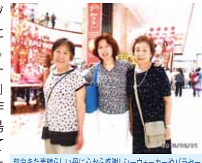
前向きな素晴らしい母に心から感謝！シーウォーカーやパラセーリング、そして射撃もして5日間を思う存分に3人で楽しみました

2回目のコーラルポイントリゾートは、今年80歳になる母と母の親友と3人で行きました。2年前にワールドビッグフォーの事を話したら「大丈夫なの？」と言っていた母です。しかし、昨年私が子ども達と本当にセブ島に旅行に行き「アレ？」と思っていたのか12月に再び話した時には、黙って話しを全部聞いてくれて「じゃあ、その旅行に行ってみようか？」と言いつつに会員になってくれました。その後、母は私が子どもの頃からお世話になっている母の親友のおば様もすぐに誘い、二つ返事で会員になり「早くその旅行に行こう！」と二人で盛り上がり、1月末この旅行に行く事になりました。日本では、なかなか機会のないシーウォーカーやパラセーリング、そして射撃もして5日間を思う存分に3人で楽しみました。母とは私が18歳で家を出てからお互いに忙しく、一緒に旅行をしたことは一度も有りませんでした。しかし、いきなり別荘付、ガイド付、ドライバー付の豪華な海外旅行を4泊5日も一緒に満喫することが出来て本当に幸せです。こんな素晴らしい環境を与えてくれたワールドビッグフォーに感謝すると共に、何より今日まで57年間、雨の日も風の日も果樹農家の仕事を続けながら健康でいてくれた前向きな素晴らしい母に心から感謝しています。親孝行のまねごとをさせてくれてありがとう！また、来年も一緒に行きましようね。