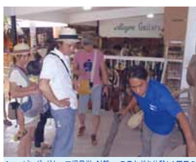
ショッピング、ギター工場見学、射撃、エステなどを体験!4回目のセブ旅行の構想も頭の中にチラチラと...有難うございました