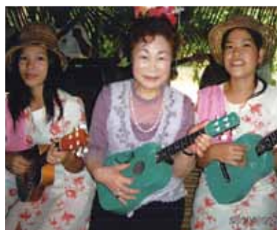
楽しかったセブ又行きます！ボホール島の小丘群チョコレートヒルに感動、眼鏡猿ターシャの可愛い事、また大蛇にビックリです