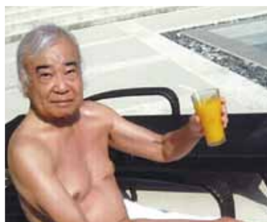
今回も素晴らしい施設、環境の中で至福の時!テレビも電話も無い静かな時間を、好きな音楽を聴きながら過ごしました