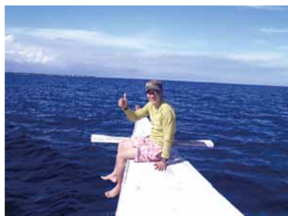
大満足!! 3度目のセブ!パンダノン島の白い砂、青い海、真っ青な空と白い雲の綺麗なことと云ったら、感激、感動の連続でした