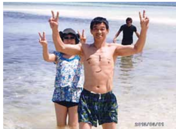
念願の2度目のセブ、すっげー楽しかった! パンダノン島の海で子供みたいに遊んだら日焼けして、あっちこっち痛くて切ない思いだった。反省……。

真冬の日本から2度目の常夏のセブ島へ! 1回目の時は、娘の結婚式のためマリンスポーツが出来ずに、くやしい思いのまま帰って来たのだが、今回は前回行けなかった所に行けて満足・満足。パラセーリングの楽しかったこと……。俺たちをつないであるロープを切ってしまうくらいずっと飛んでいたかった!! 次の日はボホール島へ、ターシャは小さくてかわいかったなあ。この島で1番印象に残ったのは「田んぼ」。刈り入れの真っ最中で、農家の俺は、どうも稲刈りが気になって、気になって。「場所が変われば違うもんだなあ」と思って眺めていたし、昔を思い出していた。そして、次の日はパンダノン島! 海で子供みたいに遊んだら日焼けして、あっちこっち痛くて切ない思いだった。反省……。それから申し訳ない事がひとつ。メイドさんがせっかく作ってくれた朝食、サラダの人参が食べられず……。ゴメンナサイ。トータル、すっげー楽しかった! 次回は4泊5日では足りない、もっともっと長い旅をしたいと思った。みんな、ありがとう。