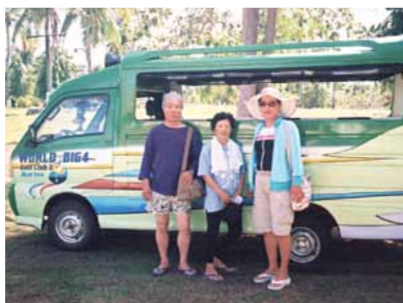
70歳の最高の贈り物でした! 感激の施設に感動の島巡り、大富豪の気分も存分に満喫、歓迎パーティーも楽しかった

セブに行きたくて会員に入らせて頂きました。まだ浅いので理解も知識もないままチャンス到来!帰りの飛行機がキャンセル待ちしか無いので駄目かと思っていたら、皆様のお陰で8泊9日になり嬉しい限り!あわててパスポートを取りやっとなにに合いました。成田は寒い日でしたが、セブ・マクタン空港に着いたら暑い、全員が降りた90%の人が観光と聞いてビックリしました。空港ではドライバー、ガイドさんが待っていてくれて安心、コーラルポイントリゾートでもメイドさん達に迎えられ感激!あまりの広さに又ビックリ!!テラスも広い眺めも最高でした。水平線も良く見え地球が丸い事を再認識、朝食も作って頂けマンゴのおいしかった事。歓迎パーティーも楽しかった!生バンドで自然に身体が動きメイドさん達のリズム感の良いのに感心しました。ドライバーとガイドさんに行きたい処に車で連れてって頂け、本当に大富豪の気分を味わえました。海に潜って魚に餌やりも出来、パラセーリングも出来ました。カモテス島への行き帰りにイルカ、飛び魚にも逢え、生まれて初めてのエステでも顔が白くなり美しくは?ボホール島の街中、チョコレートヒル、ターシャ、大蛇、蝶々、船上ランチバイキングでのパフォーマンス、感動の体験でした。JWBホテルの老人ホームも環境が良く暖かくて生活も楽で私の希望、夢です。あっという間に9日間が過ぎてしまい、ワールドビッグフォーとお世話して下さいました皆様へ感謝しております。ありがとうございました。70歳の最高の贈り物でした。