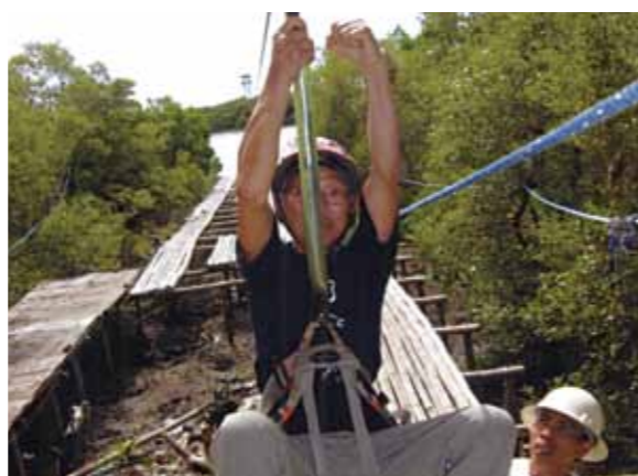
楽しかったセブ旅行、ロープによる滑車滑りで空中散歩! マッサージや射撃、ショッピングでは孫のお土産もできました

12月1日16人で寒い日本を抜け出し着いたセブのマクタン国際空港。さあ明日からセブの何処へ行こう! 出迎えてくれたスタッフの車に乗り夕食会場のフィリピン料理に舌鼓。セブに着き2日目はゴルフ組とカワサン滝組にわかれ我々はカワサン滝へ。ワールドビッグフォーのバディアンゴルフリゾートで濡れてもいいように着替え目的地へ。車を降りて歩くこと15分滝が見えてきました。竹の丸太を編んだ筏に7人乗りさあ滝つぼへ、体に当たる滝の水の水圧に皆爆笑の連発。2度3度滝に当たると体全体が和らぎ、まるでマッサージのようだ。コーラルポイントリゾートへの帰り道の中は大騒ぎと大笑いの連続。3日目はカモテス島へと予定をしたが、台風により船が出ずセブ島内の施設でロープによる滑車滑りで空中散歩と楽しむ。4日目、5日目は台風のためコーラルポイントリゾートに滞在、体を休める良い機会と思いつつ、それでもマッサージへ、射撃場へ、ショッピングセンターへとそれぞれ思い思いに繰り出す。ショッピングセンターはクリスマスの大売出し中! 孫へのお土産もできた。昼は皆で日本料理店へ。残った巻き寿司をジャンケンをし、旨そうに食べるジャンケンの勝者にヤジの連発。5日目の夜はいよいよお別れパーティー、豚の丸焼きにはビックリ! 歌に踊りにと大騒ぎ、心ゆくまで楽しむセブの夜の時間が経過した。このような機会を作ってくれたワールドビッグフォーに感謝すると共に益々の発展を祈念いたします。