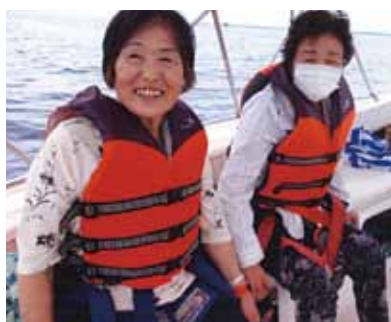
シーウォーカー、パラセーリング、射撃と体験!友人と並んだ空中では「次にもたまたましよう!」と約束して笑いました