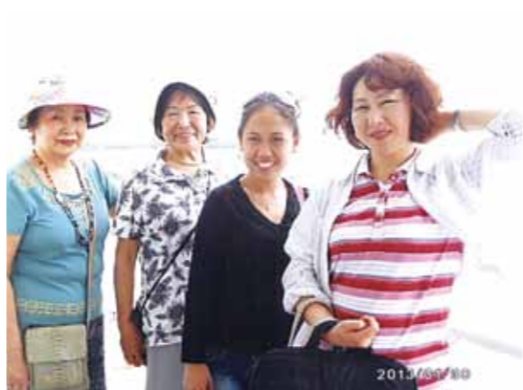
仕事を抱えて同行してくれた娘にも感激、スタッフの皆さんありがとう! 来年はもっと余裕を持ってより楽しい旅行をしたいと思っています

暮れに帰省した娘から、子供と行ったセブ島の話聞き「お母さんも行こうネ!」と言われて会員になりました。意気投合した友人と80歳間近の2人は「善は急げ」とばかり、1月末からのセブ島旅行に娘にも同行してもらいました。厳冬の朝9時、リムジンバスに乗り成田で合流した娘と3人は、午後6時過ぎ小雨のセブ・マクタン空港でガイドのラチさんの出迎えを受けました。コーラルポイントリゾートでは多勢の少女達が出迎えてくれてビックリしました。美味しいジュースを頂き、マッサージを頼みました。シーウォーカー、パラセーリング、射撃と体験して、友人と並んだ空中では「次にもたまたましよう!」と約束して笑いました。お土産にはドライマンゴを買いに行き、発展途上の街の風景も見ました。セブ島ではエネルギーを感じる街並みを通って、中国の旧正月バージョンのマルコポーロで夕食を頂きました。出迎えの時から常に気配りのある安全運転だったドライバーさん、笑顔で送り迎えしてくれたメイドさん、ありがとうございます。仕事を抱えて同行してくれた娘にも感激です。来年はもっと余裕を持ってより楽しい旅行をしたいと思っています。鬼に笑われても・・・。帰国した2月2日は特に暖かい日で良かったです。ワールドビッグフォーの一層の御発展を御祈念申し上げます。