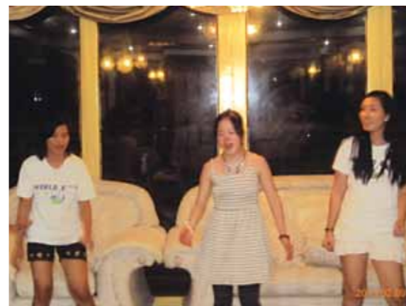
メイドさんバックにセンターで踊って大満足でした! メイドさん達みんな大好きです。またいつかお母さんとセブ島へ来たいです

お母さんとお母さんのお友達とセブに行きました。ひこうきの前には、きんちょうしました。セブ島ってどんな所なんだろうと行く前からとっても楽しみにしていました。空港についてシャロンさんに会ってすぐお友達になりました。フィリピン料理をはじめて食べたけどおいしかったです。コーラルポイントリゾートについてからたくさんのメイドさんがいて言葉はわからないけどすぐ仲よくなりました。船にのって島に行きビーチバレーやバーベキューをしたり海に入って泳いだり楽しかったです。私はホテルのプールで泳ぐのを楽しみにしていたので2回もプールで泳いだりビーチボールで遊んだりすごく楽しかったです。足つぼマッサージもとても気持ちよかったです。一番楽しかったことは夜のパーティーでメイドさんたちと歌ったりダンスをしたりした事です。メイドさん達みんな大好きです。またいつかお母さんとセブ島へ来たいです。