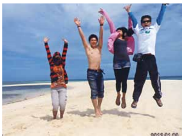
初セブ・初親子2人海外旅行！マリンスポーツやショッピング、夢のダイビングも現実に、子供はテンションが高く、超元気でした

新年1月8日、日本の気温5度の成田空港を出発。約4時間後の夕方、セブ島のマクタン空港に到着。気温28度と真夏。さっそくロビーで上着等を脱いで待つ。女性スタッフの方が名前を掲げて来てくれ、さっそく車に乗りコーラルポイントリゾートへ、大きなゲートが開き到着、直接部屋へ。女性が多いのでびっくり！少し小さめのフロントと思った所が宿泊リビングと聞いてまたびっくり！すごい事がありそうで楽しみに！！子供は黄金の寝室にテンションが高い。1月9日、島へ渡ってのバーベキュー、南国の海と砂浜、現地の人からロブスターを買って失敗(?)でもおいしかった。夕方からショッピングへ、子供は超元気！！1月10日、残念なことに雨、パラセーリングはなしに、でもシーウォーカー(小魚いっぱい)、バナナボート、ジェットスキーと十分に楽しめた。その後再び町へ。1月11日、ダイビングに参加、夢の1つに入っていた。海中ではすべてが新鮮で、見ている現実が美しい。楽しいの一言で特に小さなニモに逢えてハッピー。そして最後の食事会、フィリピン料理に挑戦、味はいかにもシンプル、その途中従業員の方々のバースデーソングと共にケーキが登場、実は子供の18歳の誕生日をお願いしていた。ビックリ顔と笑顔に私は大満足。周囲の方も拍手をしてくれ、サプライズを考えてくれたスタッフの方々に心から感謝、ありがとう！！1月12日、朝6時コーラルポイントリゾートを出発、早い朝食、朝から晩までの運転ありがとう。いつも側にいてくれてありがとう。