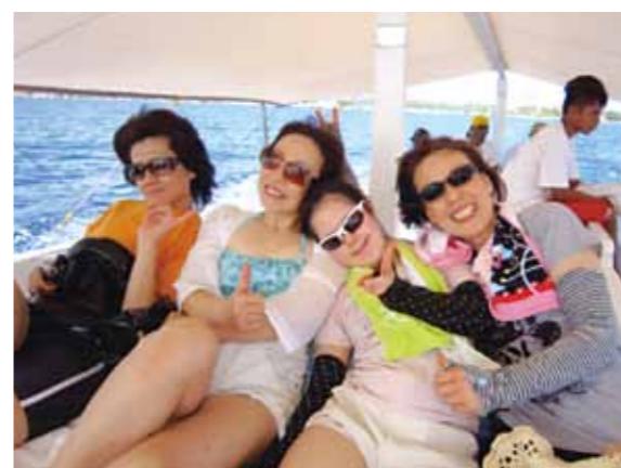
サイコーに気持ちいいなあ〜、いい笑顔でしょ、みんな! エメラルドグリーン海と潮風、とっても心地良かった

2月6日長野は雪の降る中7名で成田を出発、障害を持った我が子に沢山の体験や思い出を作りたいと思い、友達に誘われた時はすぐに「行きたい!」と返事した位です。不安と期待が半分半分でしたが、そんな不安もよそにセブ・マクタン空港についてガイドさんの笑顔で迎入れてもらい一安心、フィリピン料理とビールで乾杯し、コーラルポイントリゾートについて多勢のメイドさん達に迎えられ娘も大喜び! すぐに仲よしになりました。その夜部屋でオイルマッサージをしてもらい一日の疲れもとれました。毎日おいしいマンゴジュースと朝食をいただき、白浜パンダノン島ではビーチバレーをしたり、BBQでビールを飲んだり、ゆっくりとした時間が流れました。エメラルドグリーン海と心地よい潮風は忘れられません。ボホール島でのロボク川のクルージングや世界遺産のチョコレートヒル、世界最小の眼鏡猿を見たり、エステや足つぼマッサージなど貴重な体験を沢山しました。最後の夜のパーティーでは生バンドやメイドさん達のダンス、そこに混ざって我が娘はAKB48のダンスをメイドさんバックにセンターで踊り大満足! 娘の生き生きした姿を見て一緒に行った仲間も涙を流しながら見入っていました。日本では考えられない光景です。その夜「今度いつ来る?」と一言、またいつか来れる事を夢見てセブをあとにしました。ガイドさん、運転手さん、メイドさんのおかげです。本当にありがとうございました。