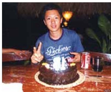
子供の18歳の誕生日、ビックリ顔と笑顔に私は大満足！サプライズを考えてくれたスタッフの方々に心から感謝、ありがとう！！