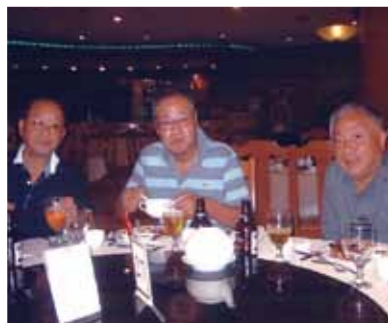
夕食のバイキングも楽しかったです! デパートのショッピング、海辺でのバーベキュー、パーティーと楽しみました