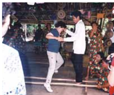
あっという間に9日間!ボホール島ではチョコレートヒル、ターシャ、大蛇、蝶々、船上ランチバイキング等、感動の体験でした