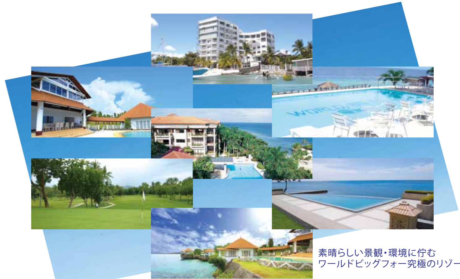
素晴らしい景観・環境に佇む ワールドビッグフォー究極のリゾート