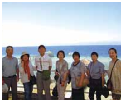
総勢16人5泊6日のセブ旅行! 毎日が大笑いの連続、豚の丸焼きにはビックリ! 心ゆくまで楽しむことができました