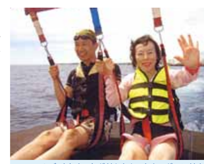
4回目のセブ、昨年まで気が付かなかったものが目に付く様な気がします! 活気が溢れるセブ、これからが楽しみです

年中仕事となりつつ半ば義務の様な、それでいて何処か待焦られるセブの旅。滞在した方なら分かる、心地良い暖かさと眩しい日差し、柔らかい海は透明度が高く熱帯の生物の観察にはもってこい、サンゴも様々な形で大小あり見飽きることがありません。9日間の内7日は毎朝海で行水です。日本なら2月は大寒ですから寒稽古でしょうか? 熱帯のセブに寒という言葉があるのか興味深いところです。そう、スーパーで毛糸のボウシを見付けました。誰が買うのかと思った翌朝、高校生ぐらいの男子がYシャツにゴム草履で毛糸のボウシ被ってました。たぶんオシャレさんなんでしょう。もう一つ土産売場で雪ダルマのネックレスを見ました。そしたら仲間が買って来て私の知り合いにプレゼントしてました。苦笑いしてました。北国じゃなく南国の物ですよ。4回目ともなると、昨年まで気が付かなかったものが目に付く様な気がします。子供達の多さには驚きです。午後9時を過ぎ、明かりも少ない中、沢山の子どもがお祭りの屋台に群がる様にとびまわっています。活気があります。これからのセブが楽しみです。何も彼もが途上の国、家だってベニヤ板にトタン板を張り付けた様な、バイクに家族全員で乗っていたり、雨をシャワーにしたり、トイレの水洗も気が向かないと流れなかったり、紅茶を注文して二杯目を頼むとお湯だけ持って来て、一度使ったティーバックをちゃぶちゃぶと、これで問題ないと、なんとおらかなこと、セブ最高!!