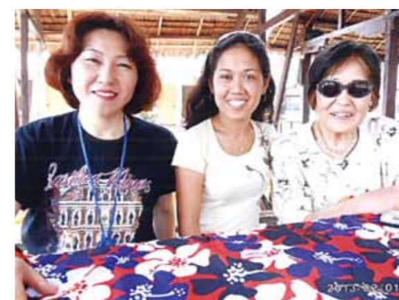
初めての母とのセブ旅行！別荘付、ガイド付、ドライバー付の豪華な海外旅行を4泊5日も一緒に満喫することが出来て本当に幸せです

2回目のコーラルポイントリゾートは、今年80歳になる母と母の親友と3人で行きました。2年前にワールドビッグフォーの事を話したら「大丈夫なの？」と言っていた母です。しかし、昨年私が子ども達と本当にセブ島に旅行に行き「アレ？」と思っていたのか12月に再び話した時には、黙って話しを全部聞いてくれて「じゃあ、その旅行に行ってみようか？」と言いつつに会員になってくれました。その後、母は私が子どもの頃からお世話になっている母の親友のおば様もすぐに誘い、二つ返事で会員になり「早くその旅行に行こう！」と二人で盛り上がり、1月末この旅行に行く事になりました。日本では、なかなか機会のないシーウォーカーやパラセーリング、そして射撃もして5日間を思う存分に3人で楽しみました。母とは私が18歳で家を出てからお互いに忙しく、一緒に旅行をしたことは一度も有りませんでした。しかし、いきなり別荘付、ガイド付、ドライバー付の豪華な海外旅行を4泊5日も一緒に満喫することが出来て本当に幸せです。こんな素晴らしい環境を与えてくれたワールドビッグフォーに感謝すると共に、何より今日まで57年間、雨の日も風の日も果樹農家の仕事を続けながら健康でいてくれた前向きな素晴らしい母に心から感謝しています。親孝行のまねごとをさせてくれてありがとう！また、来年も一緒に行きましようね。