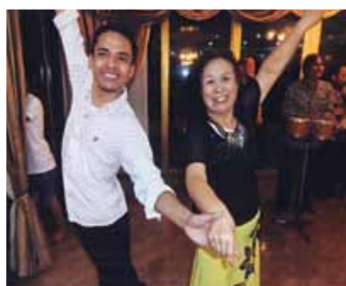
大好きなダンスを堪能し、あつという間の夢の日々でした! さよならパーティーでは、メイドさんの何種類も作ってくれたご馳走感激でした