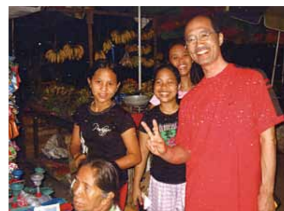
憧れのCebu9日間! 滞在した方なら分かる、心地良い暖かさと眩しい日差し、柔らかい海は透明度も高い、セブ最高!!

年中仕事となりつつ半ば義務の様な、それでいて何処か待焦られるセブの旅。滞在した方なら分かる、心地良い暖かさと眩しい日差し、柔らかい海は透明度が高く熱帯の生物の観察にはもってこい、サンゴも様々な形で大小あり見飽きることがありません。9日間の内7日は毎朝海で行水です。日本なら2月は大寒ですから寒稽古でしょうか? 熱帯のセブに寒という言葉があるのか興味深いところです。そう、スーパーで毛糸のボウシを見付けました。誰が買うのかと思った翌朝、高校生ぐらいの男子がYシャツにゴム草履で毛糸のボウシ被ってました。たぶんオシャレさんなんでしょう。もう一つ土産売場で雪ダルマのネックレスを見ました。そしたら仲間が買って来て私の知り合いにプレゼントしてました。苦笑いしてました。北国じゃなく南国の物ですよ。4回目ともなると、昨年まで気が付かなかったものが目に付く様な気がします。子供達の多さには驚きです。午後9時を過ぎ、明かりも少ない中、沢山の子どもがお祭りの屋台に群がる様にとびまわっています。活気があります。これからのセブが楽しみです。何も彼もが途上の国、家だってベニヤ板にトタン板を張り付けた様な、バイクに家族全員で乗っていたり、雨をシャワーにしたり、トイレの水洗も気が向かないと流れなかったり、紅茶を注文して二杯目を頼むとお湯だけ持って来て、一度使ったティーバックをちゃぶちゃぶと、これで問題ないと、なんとおらかなこと、セブ最高!!