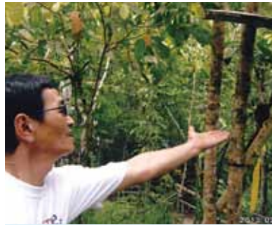
パラセーリングはずっと飛んでいたかった!! ボホール島ではターシャは小さくてかわいかったなあ。この島で1番印象に残ったのは「田んぼ」