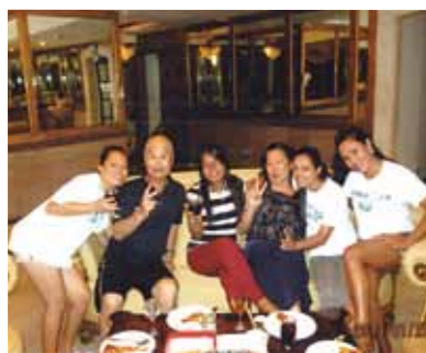
カモテス島への一泊の小旅行、シヌログカーニバルも楽しめました! またオジャマさせていただきます。待っててね!