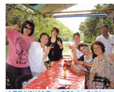
大満足の娘は「今度いつ来る?」と一言! またいつか来れる事を夢見て、ボホール島観光も最高でした

2月6日長野は雪の降る中7名で成田を出発、障害を持った我が子に沢山の体験や思い出を作りたいと思い、友達に誘われた時はすぐに「行きたい!」と返事した位です。不安と期待が半分半分でしたが、そんな不安もよそにセブ・マクタン空港についてガイドさんの笑顔で迎入れてもらい一安心、フィリピン料理とビールで乾杯し、コーラルポイントリゾートについて多勢のメイドさん達に迎えられ娘も大喜び! すぐに仲よしになりました。その夜部屋でオイルマッサージをしてもらい一日の疲れもとれました。毎日おいしいマンゴジュースと朝食をいただき、白浜パンダノン島ではビーチバレーをしたり、BBQでビールを飲んだり、ゆっくりとした時間が流れました。エメラルドグリーン海と心地よい潮風は忘れられません。ボホール島でのロボク川のクルージングや世界遺産のチョコレートヒル、世界最小の眼鏡猿を見たり、エステや足つぼマッサージなど貴重な体験を沢山しました。最後の夜のパーティーでは生バンドやメイドさん達のダンス、そこに混ざって我が娘はAKB48のダンスをメイドさんバックにセンターで踊り大満足! 娘の生き生きした姿を見て一緒に行った仲間も涙を流しながら見入っていました。日本では考えられない光景です。その夜「今度いつ来る?」と一言、またいつか来れる事を夢見てセブをあとにしました。ガイドさん、運転手さん、メイドさんのおかげです。本当にありがとうございました。