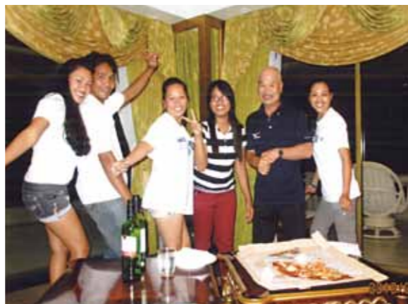
今回13回目のセブ、ワインパーティー! 日本に帰ったら、元気でバリバリ頑張るから、また連れて(?) きてやるよ。ハニー、楽しみにな。