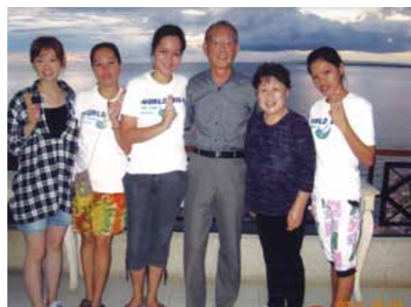
宮殿の様なコーラルポイントリゾートからの景観に感動!180度雄大な海の景観を眺め満足な気分時間に過ぎ一日の疲れを癒しました

初めての海外旅行、知り合いの方がセブ旅行に行き「コーラルポイントリゾートの部屋が豪華、美しい空気、毎朝のマンゴジュースが本当においしい、満喫した」と聞き「一度セブに行ってみよう!」と考えスケジュールを作りました。朝自宅を8時に出てセブ・マクタン空港には夕方に着いて、ガイドさんと運転手さんのお迎えで早速市内観光とフィリピン料理を楽しみ、コーラルポイントリゾートに到着!メイドさんに迎えられ部屋に案内され「宮殿の様だ!」と驚きの声をあげ、しばらく見惚れてしまいました。目の前の海、180度雄大な海の景観を眺め満足な気分時間に過ぎ一日の疲れを癒しました。翌日市内観光とボディマッサージ等体験し、豚肉とエビ、カニとフィリピン料理を良く食べ、ビールとマンゴジュースで乾杯をし幸福でした。又エメラルドグリーンの海を求めて水中メガネを使って、魚の群れと遊び楽しんだ後はバーベキューで満足をする。貝拾いも海のない県から来た私たちには優雅なひとときでした。チョコレートヒル、メガネ猿のターシャ、ロボク川でのランチ、ヤシの木の雄大さをカメラで撮りまくる思い出を作ることができました。来年も、又セブに今度は8人家族で行きたいと話合っています。良かった!!