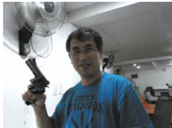
念願の射撃に大感激、とても楽しい旅と思い出をありがとうございました! またチャンスがあれば必ず行きたいと考えています

12月7日～14日、生まれて初めての海外旅行に行きました。セブ島はどんな所だろうかワクワクとした気持ちで向かいました。ボホール島のまあるいチョコレートヒル、メガネザルも名前は知っていたけど目の前で間近に見たのはとても新鮮だった!みんなで踊ったパーティーも本当に楽しく食べ物もとてもおいしくて大満足でした。特に生まれて初めてのシーウーカーはどうなることかと思いましたが、海の中を自由に歩け、色とりどりの魚たちを目の前にとっても感動し興奮しました!念願の射撃はショックの少ない物を選びましたが、何と15発中6発、的に当たりました!次回は是非もう少し重いの挑戦しようと思いましたが、若い頃、警察官に憧れていたの、的をもらってかえり、とてもよい記念になりました。スタッフの方達がとても親切にしてくれたので、気持ちよく過ごせました!またチャンスがあれば必ず行きたいと考えています。とても楽しい旅と思い出をありがとうございました。