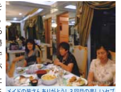
メイドの皆さんありがとう!3回目の楽しいセブ旅行はあっという間の5日間、又会う日まで

11月20日に11名で成田を出発しました。今回で3回目です。地元の皆さんと今回一緒に来る事が出来ました。2回目の時に帰りのマクタン空港のレストランで朝食の時に私の前に座った方が色が黒くて現地の人かと思ったが、その人が話しかけてきて「どちらからですか?」と、聞かれたので「日本の長野県からです」と言うと「私も日本人で横浜です。セブに架かっているマクタン大橋第一、第二の橋は私が設計をして300億、250億で施工し造った橋で、今回は少し規模は小さいが、150億程度で第三の橋を造る計画で設計を終えて帰る所です」と話をしてくれました。其処で今回はどうなって居るか興味がありましたが、まだ施工されていませんでした。今後セブの発展の為にも是非早く施工してほしいと思っています。2日目、3日目は波が荒くて船が出ず、ボホール島、カモテス島などに行けず、2日目は買物やマッサージ、市内観光、展望台へ上がり、真っ赤な夕日を見て、セブの町の夜景を望む、3日目は、男性群は船で釣りに出て、女性群は買物や観光に出て、別行動をする。4日目は船で小さな島へ渡りバーベキューを楽しみ、夜はお別れパーティーをして頂き楽しく過ごしました。コーラルポイントリゾートのスタッフの皆さん本当にお世話になりました。ありがとうございました。