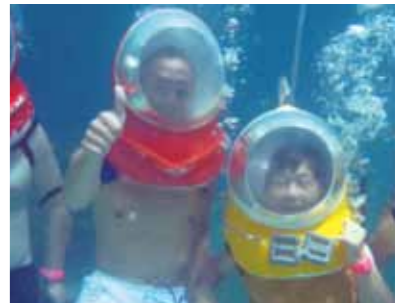
私も母も一番印象に残っているのが、水深5mの海底を歩くというシーウォーカー!楽しかった1週間のセブ島旅行はあっという間でした

私は看護師をしており、休みは皆と同じにはなかなか取れず、GWやお盆、お正月を外し海外旅行を良くしておりました。そんな時、母親に「一緒にセブ島に行こうよ!」と誘われ、友達など合わせて7人でセブ島に行くことになりました。私はリゾートに行くより、世界遺産を見たりすることが好きでしたが、行ってみて大変満足な旅でした。綺麗な海や空、おいしい食べ物などたくさんものに出会いました。また、市内観光、島巡りなどでは普段の旅行では決してできないことばかりでした。船に乗りたどり着いた島は、日本ではなかなか見る事の出来ない透き通る色の海でした。私は思わず海の中に入り、魚やいくつもの種類のウニやヒトデと触れ合い本当に楽しかったです。私も母も一番印象に残っているのが、水深5mの海底を歩くというシーウォーカーでした。はじめは「そんなものが母にも一緒にできるのか」という心配でしたが、一緒についていただいたインストラクターの方が「85歳の方もやっておられますよ!」という大変励まされる言葉でした。海の中では数えきれない綺麗な魚たちが私たちを迎えてくれました。そんな楽しかった1週間のセブ島旅行はあっという間に過ぎてしまいました。色々お世話していただいた皆様に感謝しています。