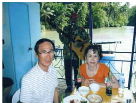
久しぶりの海外旅行、妻と2人、セブの旅を楽しんで来ました!シーウォーカーやパラセーリング、島巡り等楽しく過ごしました

妻と2人、セブの旅を楽しんで来ました。登山を趣味としていた私達は、海にはあまり興味なく、ゆったりと過ごすつもりで行きましたが、そこは新天地!シーウォーカー、パラセーリングと楽しみ、今までに無い感動を覚え、次は島巡りへと意欲が湧き、白砂のパンダノン島では砂浜を散策したりバーベキューを頂き楽しく過ごしました。ボホール島では、島の生い立ちを学び、農林業など人々の生活を伺う事が出来ました。果物はどれも熟していて、日本では味わえない南国の味だと思えます。全てスタッフの皆様のお世話のおかげです。本当に有り難く思います。又の再会を期待しています。