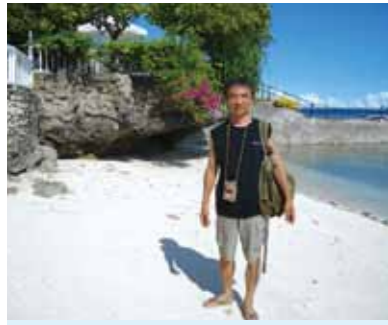
ゆったりと時を忘れさせる空間は想像以上、この上ない開放感!改めてワールドビッグフォーの素晴らしさを肌で感じていただきました。