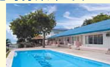
バディアンゴルフリゾート

URL http://www.jwbhotel.jp TEL 03(5817)0705