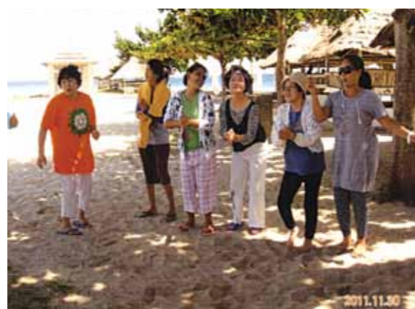
パンダノン島では久々に童心にかえり楽しい一時! 南国情緒あふれる砂浜で皆で踊り、バーベキューも最高でした

朝目覚めるとテラスの向こうにキラキラと美しい海が広がって、南国特有の樹木が並んでいた。「わあ〜とうとう来たんだ!」昨日ワクワクしながら4人で新宿から成田エクスプレスに乗ったんだ! 今日から始まりだ! おいしいマンゴや新鮮なマンゴジュース付きの朝食を4人でニコニコと頂き、パンダノン島へ! 楽しいバーベキューの昼食の後、南国情緒あふれる砂浜で皆で踊って楽しんだ。久々に童心にかえり楽しい一時だった。次の日はボホール島へ、ロボク川をクルーズしながらの食事、何箇所かの岸边では華麗な少女達のダンスが雰囲気を盛り上げていた。初めて見る小さな猿ターシャ、昼間は寝ているとの事だが、近づいて写真に収めた。おじやました!(笑)チョコレートヒルの眺めも珍しいものでした。シューマートやアヤラデパートに買物に行ったこと、4人仲良く連れ立ってあちこち見学したこと等々、走馬灯のように蘇ってきて感謝のこのごろです。