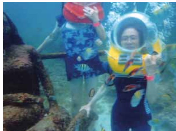
前回出来なかったシーウォーカー、夢の叶った一時でした!海底の熱帯魚と遊ぶ事が出来感激、又パラセーリングも大空や風を感じ感動です

11月1日から8日間、女性4人でのセブ旅行です。日本も11月に入ったのに大変暖かく、軽装で出掛ける事が出来ました。二度目のセブ行きですが成田での手続き等が少し心配でした。飛行機に乗りセブ・マクタン空港に予定通り到着出来、お迎えのガイドさんを見つけた時は心配も吹き飛びました。到着した夜のフィリピン料理は、とてもおいしく頂きました。ゆっくり休み、次の日から疲れもなく市内見学やお買い物に出掛けました。カモテス島行きは波も静かで、途中イルカの群れに逢う事が出来楽しい船旅でした。心のこもった御馳走を頂き島内観光へ!車で洞窟行きです。入ると鍾乳洞、先に池が有り泳ぐ人がいてビックリしました。珊瑚の島なんだと感じました。前回出来なかったシーウォーカーで海底の熱帯魚と遊ぶ事が出来、夢の叶った一時でした。又パラセーリングも大空や風を感じ感動です。ボホール島ではロボク川クルーズやチョコレートヒルの不思議な世界で良い写真をとる思い、ホーキに乗ったり楽しい一日でした。青い海、心地良い潮風、優しい笑顔、素晴らしい環境に心が癒され、身も元気になり、思い切り楽しむ事が出来、心に残る旅になりました。それもわがままな我々にいつでも献身的に見守って下さった、ガイドさん、ドライバーさん、メイドさん達のお陰です。ありがとうございました。