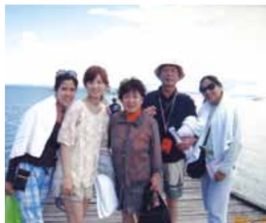
今度は8人家族で行きたいと話合っています!市内観光やマッサージ、島巡りに食事等楽しい思い出を作る事ができました