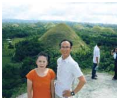
又の再会を期待しています!ボホール島観光では、島の生い立ちを学び、農林業など人々の生活を伺う事が出来ました