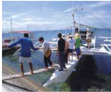
スタッフの優しさ、心遣いに「有難う有難う」と涙が出ました！パンダノン島では、「これこそセブの海！」と感動、元気を頂き、楽しい一時でした