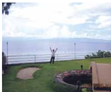
やっと来ましたバディアンゴルフリゾートへ！これぞワールドビッグフォーの施設全部の素晴らしい安堵の体感！