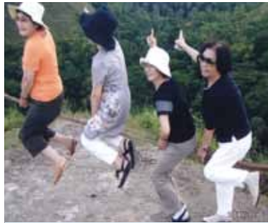
ボホール島ではホーキに乗ったり楽しい一日でした!素晴らしい環境は心が癒され思い切り楽しむ事が出来、心に残る旅になりました