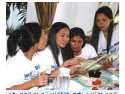
スタッフの皆さんに心より感謝致します!メイドさんは会報を見ながら懐かしそうにゲストの名前を覚えておられました

セブの海は青くエメラルドに輝き、鏡の様な海面に白い雲が地平線と一体と成り、その間をカモテス島に向かう船は、夢を乗せて2時間半、降り注ぐ太陽から元気を頂き、エメラルドの海からの風、香りは、皆の心を幸せにさせてくれます。何年か前に訪れた時には、浅瀬の階段の上に植えられていた「まだ私達の背丈と同じ位のヤシの木」が、もうこんなに大きく成り、たわわに黄色い美味しそうなお実を付けて私達を待っていてくれました。プールで海で存分泳ぎ、昼には大きなカツオ、イカ等のバーベキューを頂き、帰りの船では、イルカに会うこともできました。コーラルポイントリゾートでは、メイドさんに会報を見せてあげました。皆さん喜んで指をさしながら「あの、此の人」と懐かしそうに会報を見つめている姿が印象に残りました。又、昼食に日本よりソーメンを沢山持っていき、メイドさんと一緒に食べましたが「美味しい、美味しい」と皆が「ソーメンパーティーだ」と大変喜んで食べてくれたのも、思い出に残りました。さよならパーティーのとき、松本の皆さんが持参した「きよしのズンドコ節」のCDでメイドさんを含め、全員で踊ったのも思い出の一つとなりました。今回は、久しぶりに行ったカモテス島の美しいグリーンの芝と、手の届くところで実る果実と接することができたのも、大きな感動でした。いつも、いつも、私達を見守り、サポートして下さる、東京事務所のスタッフの皆さん、セブの皆さんに心より感謝致します。