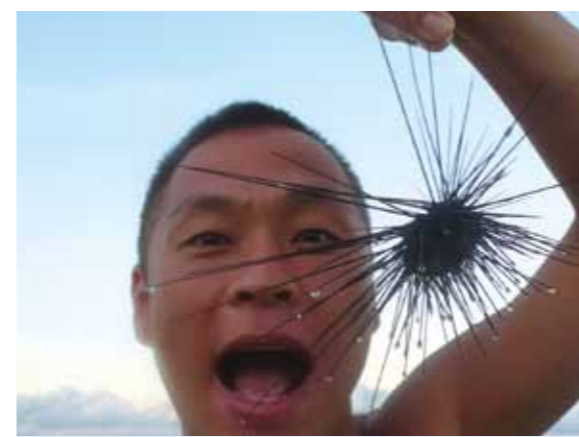
市内観光、島巡りなどでは普段の旅行では決してできないことばかり!魚やいくつもの種類のウニやヒトデと触れ合い本当に楽しかったです

私は看護師をしており、休みは皆と同じにはなかなか取れず、GWやお盆、お正月を外し海外旅行を良くしておりました。そんな時、母親に「一緒にセブ島に行こうよ!」と誘われ、友達など合わせて7人でセブ島に行くことになりました。私はリゾートに行くより、世界遺産を見たりすることが好きでしたが、行ってみて大変満足な旅でした。綺麗な海や空、おいしい食べ物などたくさんものに出会いました。また、市内観光、島巡りなどでは普段の旅行では決してできないことばかりでした。船に乗りたどり着いた島は、日本ではなかなか見る事の出来ない透き通る色の海でした。私は思わず海の中に入り、魚やいくつもの種類のウニやヒトデと触れ合い本当に楽しかったです。私も母も一番印象に残っているのが、水深5mの海底を歩くというシーウォーカーでした。はじめは「そんなものが母にも一緒にできるのか」という心配でしたが、一緒についていただいたインストラクターの方が「85歳の方もやっておられますよ!」という大変励まされる言葉でした。海の中では数えきれない綺麗な魚たちが私たちを迎えてくれました。そんな楽しかった1週間のセブ島旅行はあっという間に過ぎてしまいました。色々お世話していただいた皆様に感謝しています。