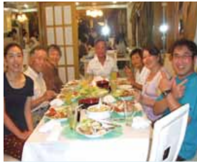
初めての海外旅行はワクワクセブ島! ボホール島観光に感動のシーウーカー、みんなで踊ったパーティーも本当に楽しく大満足でした