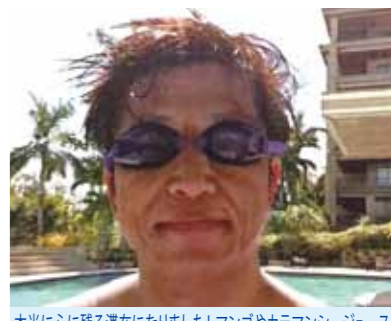
本当に心に残る滞在になりました! マンゴやカラマンシージュースが美味しかったし、オイルマッサージも安くて気持ちよかったです

海外旅行が大好きで、今まで欧米・アジアいろいろな国々を旅してきましたが、セブは今回初めて。正月休みに大雪の新潟から逃げるように暖かいセブに5日間滞在しました。天気予報では5日間とも雨でしたが、普段日々のおこないが良いせいか(笑)1日目以外は全て晴れ男になりました。おかげでセブの気候、自然を満喫できました。セブに行く以前は治安を心配しましたが、街を歩いても全然問題なかったし、逢う人みんな親切で笑顔で接してくれるので、フィリピンの印象も行く前とはずいぶん変わりました。5日間で体験したセブ市内観光、夜景観賞、カジノ、船での島巡りとバーベキュー、ショッピング、食事、ビーチやプール等のリゾート施設、どれもこれも素晴らしかったです。特にメイドさんが作ってくれた朝食やマンゴやカラマンシージュースが美味しかったし、オイルマッサージも安くて気持ちよかったです。マンゴが毎日食べれるのは嬉しいですね。連日夜遅くまでお世話になったガイドさん、メイドさん達のおかげで本当に心に残る滞在になりました。帰る時もリゾートから離れたなくて、ずっと滞在していたかったくらいです。再び近いうちに行きたいと思うので、その時はまたよろしく願いいたします。本当にありがとうございました。