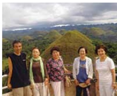
チョコレートヒルの眺めも珍しいものでした! ボホール島ではロボク川をクルーズしながらの食事、ターシャも写真に収めました