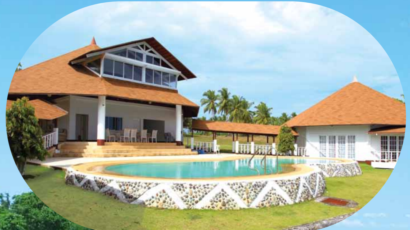
雄大なる大自然を満喫! 珊瑚礁の島カモテスリゾート