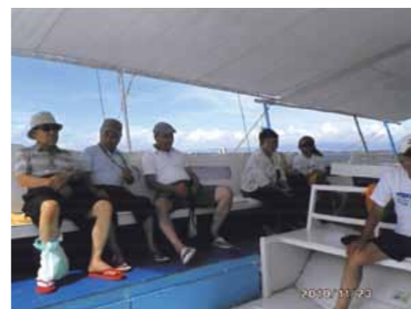
船で小さな島へ渡りバーベキューを楽しみました!南国の海でのんびりと一日過ごし、又次の機会を楽しみにしています

11月20日に11名で成田を出発しました。今回で3回目です。地元の皆さんと今回一緒に来る事が出来ました。2回目の時に帰りのマクタン空港のレストランで朝食の時に私の前に座った方が色が黒くて現地の人かと思ったが、その人が話しかけてきて「どちらからですか?」と、聞かれたので「日本の長野県からです」と言うと「私も日本人で横浜です。セブに架かっているマクタン大橋第一、第二の橋は私が設計をして300億、250億で施工し造った橋で、今回は少し規模は小さいが、150億程度で第三の橋を造る計画で設計を終えて帰る所です」と話をしてくれました。其処で今回はどうなって居るか興味がありましたが、まだ施工されていませんでした。今後セブの発展の為にも是非早く施工してほしいと思っています。2日目、3日目は波が荒くて船が出ず、ボホール島、カモテス島などに行けず、2日目は買物やマッサージ、市内観光、展望台へ上がり、真っ赤な夕日を見て、セブの町の夜景を望む、3日目は、男性群は船で釣りに出て、女性群は買物や観光に出て、別行動をする。4日目は船で小さな島へ渡りバーベキューを楽しみ、夜はお別れパーティーをして頂き楽しく過ごしました。コーラルポイントリゾートのスタッフの皆さん本当にお世話になりました。ありがとうございました。