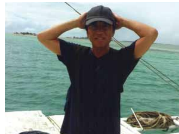
セブ癒しの旅、気候、自然を満喫できました! セブ市内観光や夜景観賞、島巡りにショッピング等、どれもこれも素晴らしかったです

海外旅行が大好きで、今まで欧米・アジアいろいろな国々を旅してきましたが、セブは今回初めて。正月休みに大雪の新潟から逃げるように暖かいセブに5日間滞在しました。天気予報では5日間とも雨でしたが、普段日々のおこないが良いせいか(笑)1日目以外は全て晴れ男になりました。おかげでセブの気候、自然を満喫できました。セブに行く以前は治安を心配しましたが、街を歩いても全然問題なかったし、逢う人みんな親切で笑顔で接してくれるので、フィリピンの印象も行く前とはずいぶん変わりました。5日間で体験したセブ市内観光、夜景観賞、カジノ、船での島巡りとバーベキュー、ショッピング、食事、ビーチやプール等のリゾート施設、どれもこれも素晴らしかったです。特にメイドさんが作ってくれた朝食やマンゴやカラマンシージュースが美味しかったし、オイルマッサージも安くて気持ちよかったです。マンゴが毎日食べれるのは嬉しいですね。連日夜遅くまでお世話になったガイドさん、メイドさん達のおかげで本当に心に残る滞在になりました。帰る時もリゾートから離れたなくて、ずっと滞在していたかったくらいです。再び近いうちに行きたいと思うので、その時はまたよろしく願いいたします。本当にありがとうございました。