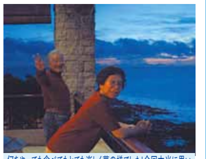
何を食べても食べても楽しく夢の様でした!今回本当に思いきってセブ島へ来て良かったと思います。又是非遊びに行きます

姉夫婦とその子供達、私と母と友達で今回思い切ってセブ島へ行きました。久しぶりの海外と言う事で、少し心配はありましたが、皆と一緒にと言う事でとても楽しみでした。向こうに着くと天気は雨でした。2日目は、海へと行きました。初めてのシーウォーカー!!TVで見た事は何回かありましたが、なんだかとても不思議でした。魚が沢山私の方へ寄って来て、とても楽しい時間を過ごしました。その後、ジェットスキーにも乗り、久しぶりに若い頃に戻った様な気がしました。お昼になり焼肉を食べコーラルポイントリゾートに戻りました。私の母も歩くのが大変なのですが、ガイドさん達に支えてもらい、不自由なく移動する事が出来ました。次の日も天気は雨と言う事で海は諦め、買い物をしたり、実弾の射撃場へ行きました。昔から一度やってみたくと思っていた事が、又一个出来てとても嬉しかったです。実弾の迫力はとても凄かったです。その後ビリヤードをやったり卓球をしたり皆で楽しく遊びました。いつもは母や姉とは離れて暮らしているの、何を食べても食べてもとても楽しく本当に夢の様でした。今回本当に思いきってセブ島へ来て良かったと思います。又是非遊びに行きたいと思えます。色々ありがとうございました。