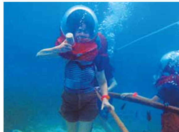
セブ島で初めてのシーウォーカー!!魚が沢山私の方へ寄って来て、とても楽しく久しぶりに若い頃に戻った様な気がしました

姉夫婦とその子供達、私と母と友達で今回思い切ってセブ島へ行きました。久しぶりの海外と言う事で、少し心配はありましたが、皆と一緒にと言う事でとても楽しみでした。向こうに着くと天気は雨でした。2日目は、海へと行きました。初めてのシーウォーカー!!TVで見た事は何回かありましたが、なんだかとても不思議でした。魚が沢山私の方へ寄って来て、とても楽しい時間を過ごしました。その後、ジェットスキーにも乗り、久しぶりに若い頃に戻った様な気がしました。お昼になり焼肉を食べコーラルポイントリゾートに戻りました。私の母も歩くのが大変なのですが、ガイドさん達に支えてもらい、不自由なく移動する事が出来ました。次の日も天気は雨と言う事で海は諦め、買い物をしたり、実弾の射撃場へ行きました。昔から一度やってみたくと思っていた事が、又一个出来てとても嬉しかったです。実弾の迫力はとても凄かったです。その後ビリヤードをやったり卓球をしたり皆で楽しく遊びました。いつもは母や姉とは離れて暮らしているの、何を食べても食べてもとても楽しく本当に夢の様でした。今回本当に思いきってセブ島へ来て良かったと思います。又是非遊びに行きたいと思えます。色々ありがとうございました。