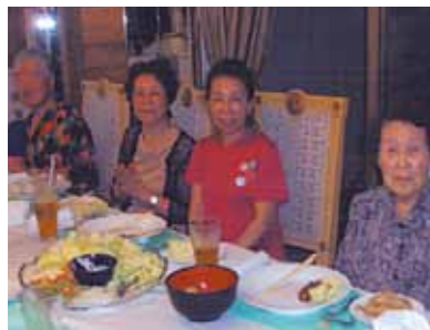
何不自由なく過ごす事が出来ました!日本にいたら皆で遊ぶと言う事は無いと思います。とても貴重な時間を過ごせたと思います。