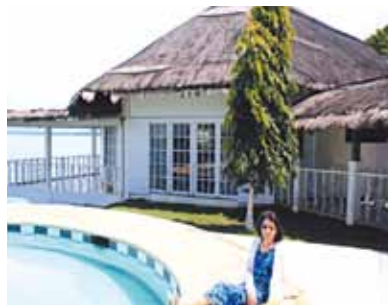
あつという間の4泊5日の旅!次はボホール島観光等やりたい事盛り沢山!!またセブに行きたいと思っております