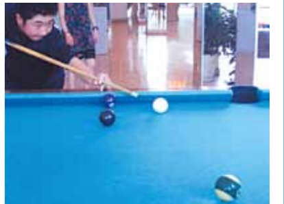
4泊5日の素晴らしいセブ島!メイドさんやドライバーさんに優しくしてもらいとても楽しく過ごすことができました

自分は、幼い頃にハワイに行ってきた。まだ、その頃の記憶はなく、セブ島に行くことになったときは、とても嬉しい気持ちでいっぱいでした。セブ島に行く前夜もワクワクしてあまり寝れませんでした。そして、セブ島に着きました。まず最初に感じたのは「暑い〜!」の一言でした。車の中では寝てしまい気付けばコーラルポイントリゾートでした。2日目は、待ちに待ったシーウォーカー!!とジェットスキーでした。シーウォーカーでは周りに魚がいて凄く貴重な体験でした。お昼には焼肉を食べ夜にはコーラルポイントリゾートに戻りました。次の日は雨でした。雨だったので外では何もできませんでした。そこで射撃場に行くことになりました。実弾で凄く反動がありビックリ!ここでも貴重な体験ができました。次の日もまた雨、最終日も雨でした。なので最終日前日まで買い物をしたり、あたりを周りました。最終日には朝4時半に起きました。パイナップルジュースを飲み空港に行きました。空港では優しくしてくれたメイドさんに別れを告げて帰国しました。セブに行ってから4泊5日間メイドさんやドライバーさんに優しくしてもらいとても楽しく過ごすことができました。ありがとうございました。