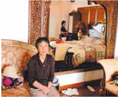
人生の1ページを飾ってくれたセブ島!またチャンスを作ってぜひ行きたいと思っています