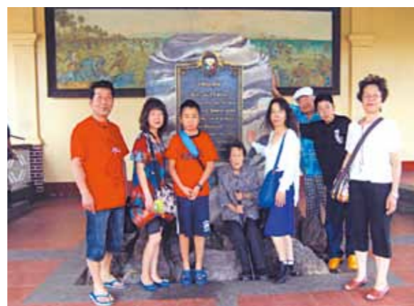
2度目のセブ旅行は家族旅行!娘や孫達はシーウォーカーやジェットスキーを楽しみ、母もセブ旅行を大変楽しんでおりました

今回のセブ島は、お陰様で2度目となります。前回とは違い私の娘と孫、そして私の妹と母を連れていく事が出来ました。私も母も足が思う様に動かず、とても心配でしたが、そんな心配は無用でした。空港に着くと、すぐにガイドの方が車イスを用意してくれました。とても美味しいマンゴのジュースも頂き、いよいよセブ旅行の始まりです。その日はもう夜だったので、その後、ゆっくりと休みました。2日目の朝、天気は雨・・・それでも海へと向かいました。そして私は出来ませんでしたが、娘や孫達はシーウォーカーを楽しんだり、とてもやりたがっていたジェットスキー等を楽しみました。今日本は冬の真っ只中、なんだかとても不思議な感じでした。私も母も足が悪いのを忘れて色々楽しみました。メイドさんもガイドさんもとても優しく、何不自由なく過ごす事が出来ました。その後も天気には残念ながら恵まれなく、予定を変更してショッピングをしたり皆でボーリング、卓球等をして遊びました。日本にいたらこうやって皆で遊ぶと言う事は無いと思います。そう考えただけでもとても貴重な時間を過ごせたと思います。改めて感謝しております。母も大変楽しんでおり、やはり連れて来て良かったと思いました。本当にありがとうございました。