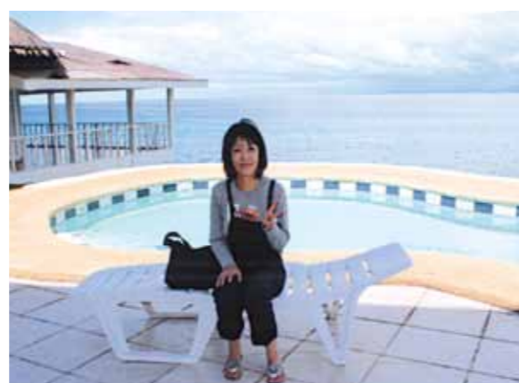
10年振りのセブ、カモテス島ではバーベキューに舌鼓!緑と海に囲まれた、本当にステキなリゾートへと変わっていてビックリでした

平成12年6月の初めてのセブ島旅行から10年半振り、2回目のセブ島に行って来ました。当時のカモテス島は本当に何の施設もなく現地の方が手作業で整地をしていたり、お手洗いや地元の民家で借りるような状況でした。そんな中、屋外でのバーベキューで頂いた白身魚が大変美味しかったことを覚えています。今回、そのカモテス島がどんな風になっているか楽しみにしていました。施設写真集で見た通り、緑と海に囲まれた、本当にステキなリゾートへと変わっていてビックリでした!バーベキューの美味しさは変わっていませんでしたね!他のリゾート施設の見学はできませんでしたが、きっとステキなリゾートでしょうね。セブの青い空ときれいな海は変わらずにステキなリゾート施設を増やして欲しいなと思っております。今回はのんびり旅行でしたので、次回はエステやネイル、大好きな買い物も、もっと楽しみたいと思っております。今回案内して下さったスタッフの皆さん、楽しい4泊5日ありがとうございました。次回は10年後と言わず、1年に1度位行けたらいいなと思っております。その時はまたよろしく願いいたします。