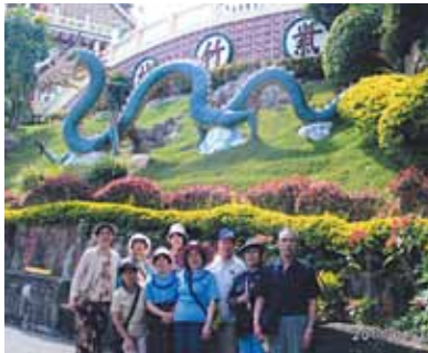
海好きの私の印象はパンダノン島!青く輝く海の色、白い波、潮騒の心地良さ、心身共に癒されました