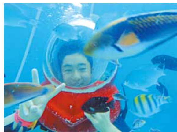
待ちに待ったシーウォーカー!!とジェットスキー!!シーウォーカーでは周りに魚がいて凄く貴重な体験ができました

自分は、幼い頃にハワイに行ってきた。まだ、その頃の記憶はなく、セブ島に行くことになったときは、とても嬉しい気持ちでいっぱいでした。セブ島に行く前夜もワクワクしてあまり寝れませんでした。そして、セブ島に着きました。まず最初に感じたのは「暑い〜!」の一言でした。車の中では寝てしまい気付けばコーラルポイントリゾートでした。2日目は、待ちに待ったシーウォーカー!!とジェットスキーでした。シーウォーカーでは周りに魚がいて凄く貴重な体験でした。お昼には焼肉を食べ夜にはコーラルポイントリゾートに戻りました。次の日は雨でした。雨だったので外では何もできませんでした。そこで射撃場に行くことになりました。実弾で凄く反動がありビックリ!ここでも貴重な体験ができました。次の日もまた雨、最終日も雨でした。なので最終日前日まで買い物をしたり、あたりを周りました。最終日には朝4時半に起きました。パイナップルジュースを飲み空港に行きました。空港では優しくしてくれたメイドさんに別れを告げて帰国しました。セブに行ってから4泊5日間メイドさんやドライバーさんに優しくしてもらいとても楽しく過ごすことができました。ありがとうございました。