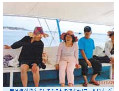
一度は海外旅行を試してみるものですね!ワールドビッグフォーセブ旅行に参加して心に残る体験が出来ました

私は海外旅行が初めてなので楽しさ半分、不安半分でしたが、責任者の方が一緒に同行下さりまして、困る事、わからない事全部手に取って教えて頂きまして、心配をしなくてとても良かったです。空港へ無事に着きましてホッとしました。28日前までは毎日雨だったそうです。天気が心配だったけど29日から晴天の日が続きました。良かったです。島へ船で行き現地にてバーベキューをしたり、海へ入って遊んだりしました。海の水がきれいでした。次の日からセブ市内見学でした。日本には無い様な大きなショッピングセンターで買い物をして来ました。サントニーニョ教会堂。目がさめる様なお寺。すばらしかったです。ワールドビッグフォーリゾート貴社所有の土地の広さやホテルの大きさ、すばらしさ、目をみはるばかりです。又毎日の食事が好みの食であったのでとても良かったです。ワールドビッグフォーセブ旅行に参加して心に残る体験が出来ました。本当に有難う御座いました。一度は海外旅行を試してみるものですね。