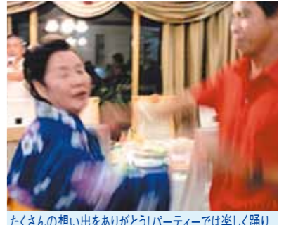
たくさんの思い出をありがとう!パーティーでは楽しく踊り、涙が出るほど笑いました。もう一度行きたいと思えます

数日前に「海外に行っていたんだ」なんて夢の様です。マクタン空港に着いた時、声をあげて「どうとう来てしまいました」と、言ったことは覚えています。スタッフの方が迎えに来てくれていました。初めてお逢いする人達なのに、やさしく話しかけてくれましたし、車の乗り降りにもドライバーさんは気をつけてくれまして、頭を車に打たないようにと、自分の手を車に添えてくれていました。ほんとうに「心のやさしい人達なんだ」と感心しました。それに、名ドライバーさんにも驚きました。朝食の時のマンゴジュースが美味しかったですね。メイドさんも、いつもニコニコして、出掛ける時もお迎えもしてくれました。島に渡ってバーベキュー、中国のお寺参り、教会、デパート、市場、ワールドビッグフォーの本社オフィス、宿泊施設と、短い日数の中に、たくさん思い出を作ってくださいまして、ほんとうにありがとうございました。最後の夜、パーティーをして下さいまして、ドライバーさんが女装で踊ってくれました。涙が出るほど笑いました。元気でいたら、もう一度行きたいと思えます。