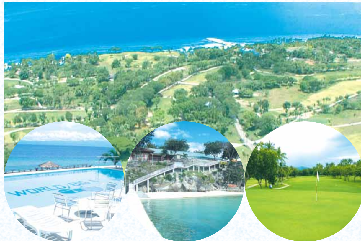
18ホールのシーサイドゴルフコースを所有するバディアンゴルフリゾート