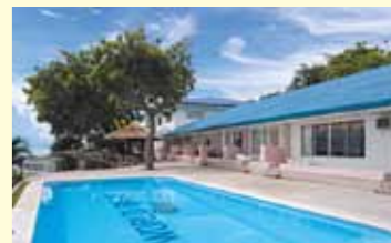
バディアンゴルフリゾート

URL http://www.jwbhotel.jp TEL 03(5817)0705