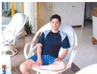
まだ滞在したいと思ふ様な心に残る旅になりました!シーウォーカーやパラセーリングに感激、セブ島の景色、自然の美しさに感動です