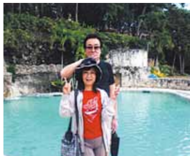
素晴らしいセブの思い出ができました!島巡りや市内観光等を満喫、また美しいセブの海に逢える日を楽しみにしております