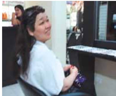
風が優しいセブの休日に感動!コーラルポイントリゾートのパルコニーの風が心地良く「いつまでもふかれていたい」って感じました