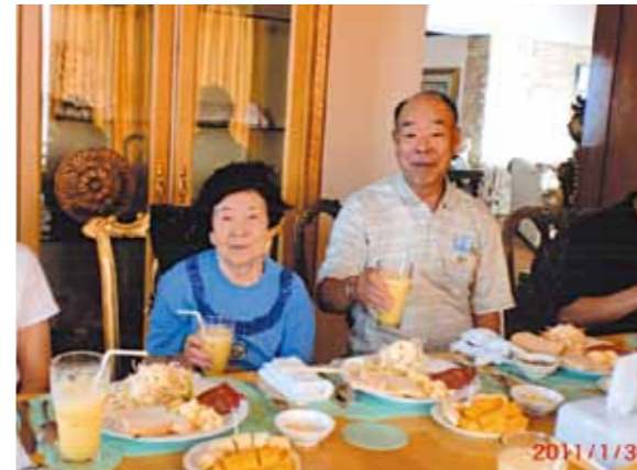
毎日の食事が好みの食であったのでとても良かったです!天候にも恵まれ、すばらしい旅行が出来本当にありがとうございました

私は海外旅行が初めてなので楽しさ半分、不安半分でしたが、責任者の方が一緒に同行下さりまして、困る事、わからない事全部手に取って教えて頂きまして、心配をしなくてとても良かったです。空港へ無事に着きましてホッとしました。28日前までは毎日雨だったそうです。天気が心配だったけど29日から晴天の日が続きました。良かったです。島へ船で行き現地にてバーベキューをしたり、海へ入って遊んだりしました。海の水がきれいでした。次の日からセブ市内見学でした。日本には無い様な大きなショッピングセンターで買い物をして来ました。サントニーニョ教会堂。目がさめる様なお寺。すばらしかったです。ワールドビッグフォーリゾート貴社所有の土地の広さやホテルの大きさ、すばらしさ、目をみはるばかりです。又毎日の食事が好みの食であったのでとても良かったです。ワールドビッグフォーセブ旅行に参加して心に残る体験が出来ました。本当に有難う御座いました。一度は海外旅行を試してみるものですね。