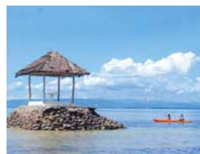
楽しい思い出をたくさんありがとうございました!私の誕生日にはパーティーを開いてくれ大感激でした

1月中旬、寒い日本から母親と2人初めてのセブ島へ。2日目は市内観光とショッピング。初めて食べるフィリピン料理は、想像していたより食べやすく美味しかったです。3日目は、あいにくのどしゃぶり雨、ボホール島行きの予定を急遽変更。急な予定の変更にもガイドのシャロンがすぐに対応して、スケジュールを組み直してくれ一安心でした。エステで全身リラックス、癒された後は、オカマショーへ連れて行ってくれました。本当に男の人!?と驚くほど綺麗で、とても楽しいショーでした。夜には、この日が誕生日の私のために、誕生日のパーティーを開いてくれました。豪華なコーラルポイントリゾートでのバイキングに、大感激!楽しい時間を過ごしました。最終日の前日は、やっと晴天に恵まれ、船に乗りビーチへ。透き通る綺麗な海で泳いだり、バーベキューをしたり、ゆっくりと過ごしました。あつという間に時間は過ぎ帰国の日になりました。ワールドビッグフォーの皆様、楽しい思い出をたくさんありがとうございました。