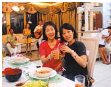
1年に1度位行けたらいい!セブの青い空ときれいな海は変わらずにステキなリゾート施設を増やして欲しいなと思っております