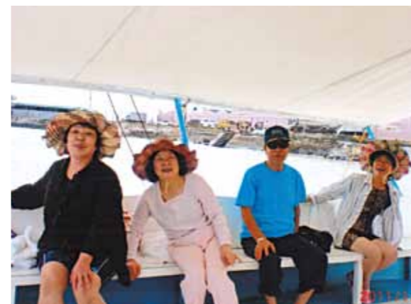
「どうとう来てしまいました」初めての海外旅行!島巡りや市内観光等を満喫、やさしいスタッフ達には感謝しました

数日前に「海外に行っていたんだ」なんて夢の様です。マクタン空港に着いた時、声をあげて「どうとう来てしまいました」と、言ったことは覚えています。スタッフの方が迎えに来てくれていました。初めてお逢いする人達なのに、やさしく話しかけてくれましたし、車の乗り降りにもドライバーさんは気をつけてくれまして、頭を車に打たないようにと、自分の手を車に添えてくれていました。ほんとうに「心のやさしい人達なんだ」と感心しました。それに、名ドライバーさんにも驚きました。朝食の時のマンゴジュースが美味しかったですね。メイドさんも、いつもニコニコして、出掛ける時もお迎えもしてくれました。島に渡ってバーベキュー、中国のお寺参り、教会、デパート、市場、ワールドビッグフォーの本社オフィス、宿泊施設と、短い日数の中に、たくさん思い出を作ってくださいまして、ほんとうにありがとうございました。最後の夜、パーティーをして下さいまして、ドライバーさんが女装で踊ってくれました。涙が出るほど笑いました。元気でいたら、もう一度行きたいと思えます。