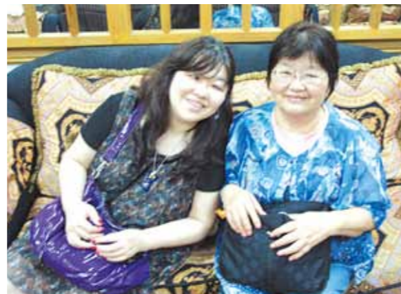
こんな素敵なバカンスをいただけて夢のようです!「今度は蒼い海や空もいっぱい見ようね!」そう言って次の楽しみも出来ました

お正月の休日、母と二人、初めてのセブに行って来ました。マニラ経由での入国でしたがフィリピンの方は、皆ニコニコと親切で、これからの旅に期待も高まります。夕闇海岸沿い、それは美しいセブの灯りの輝きに感動しながら空港に到着したのは、予定より3時間程も遅れてしまいましたが、ずっと待っていて下さったスタッフの皆さんのお迎えに心もふんわか癒されます。私達はゆっくり過ごし、特に母は今まで遊ぶことなどほとんどなかったの、初めてのエステやマッサージなど、とても喜んで、そんな笑顔が見られたのが本当に嬉しかったです。私はコーラルポイントリゾートのお部屋のパルコニーの風がとても心地良く「いつまでもふかれていたい」って感じました。今回は雨期のためお天気には恵まれなかったですが「今度は蒼い海や空もいっぱい見ようね!」そう言って次への楽しみも出来ました。いつも笑顔で可愛らしくいて下さるメイドさんたちにも本当に感謝です。こんな素敵なバカンスをいただけて夢のようです。ありがとうございます。